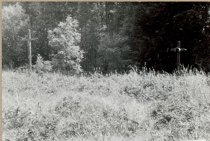
3. Zachodnia granica cmentarza