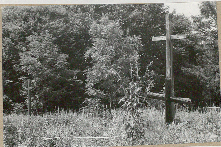
5. Krzyż drewniany widok od strony południowej