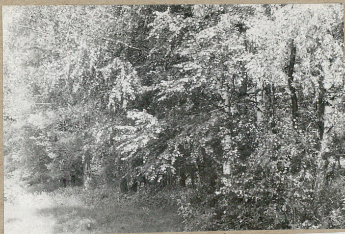
4. Krzyże drewniane w środkowej części cmentarza