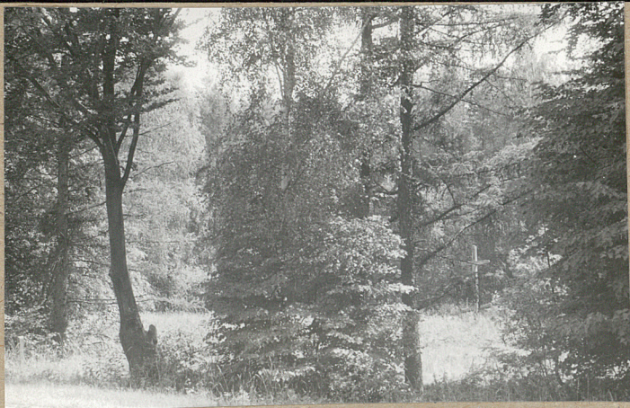
1. Środkowa część cmentarza widok od strony drogi