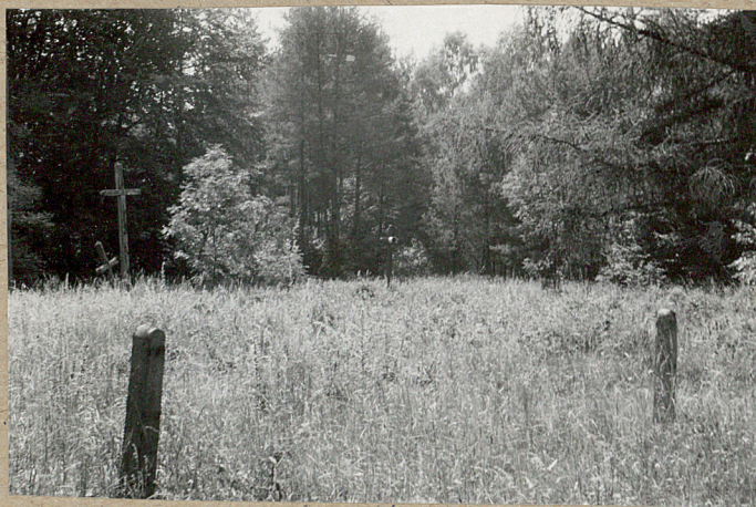
2. Widok cmentarza od strony wschodniej