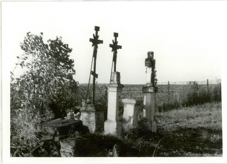
4. Grupa nagrobków z przeł. XIX-XXw. przeniesionych z d. cmentarza przy- cerkiewnego.