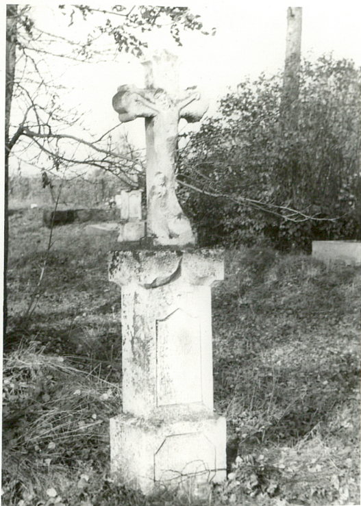
8. Nagrobek kamienny, Wasyl Goja, zm. 1911r.