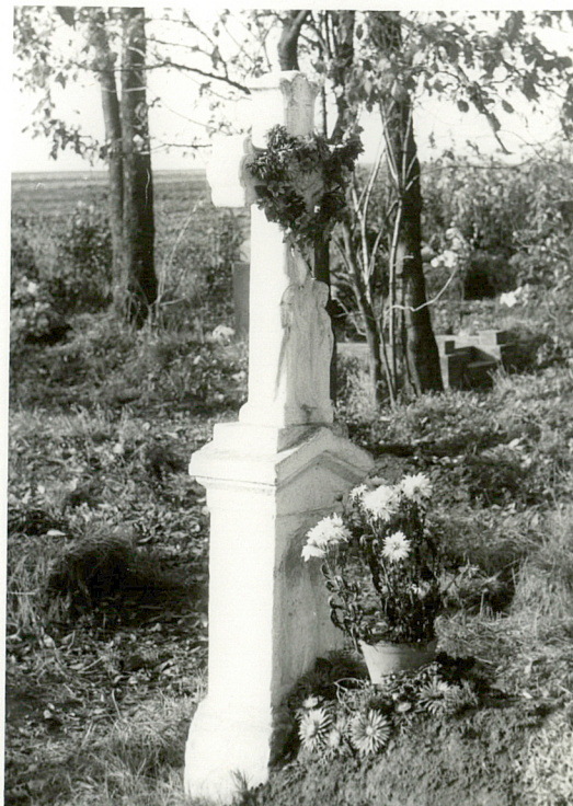
15. Nagrobek kamienny, napis nieczytelny, pocz. XXw.