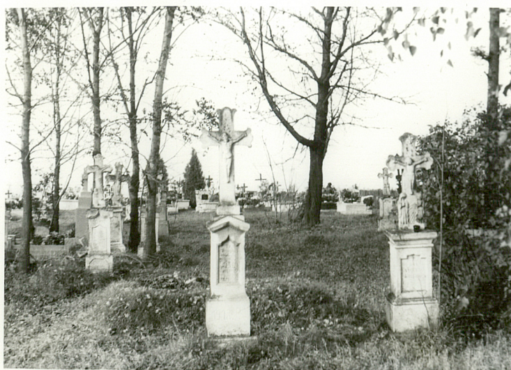
3. Nagrobki we wschodniej części.