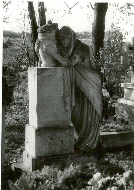
13. Rzeźba nagrobna na grobie Stanisława Sołtysika, dziedzica Zabłotiec, zm. 1867r.