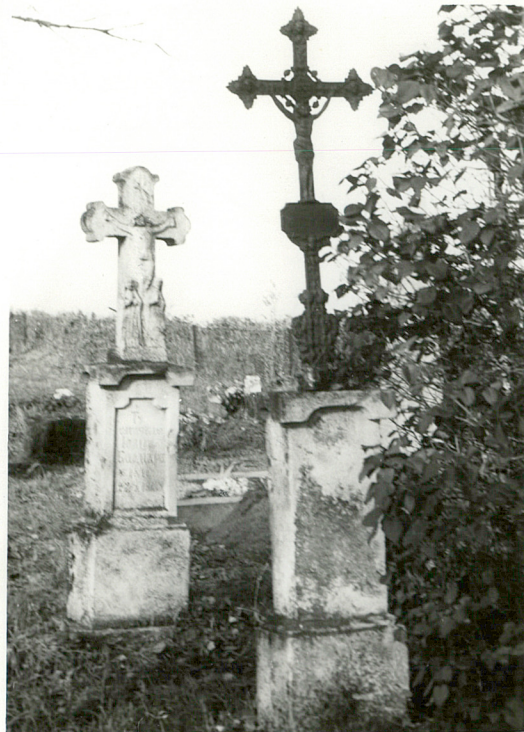
9. Nagrobek kamienny - Iwan Bagnar zm. 1903r., krzyż żeliwny, napis nieczytelny, pocz. XXw.