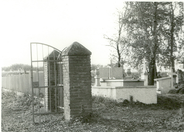
1. Brama wejściowa.