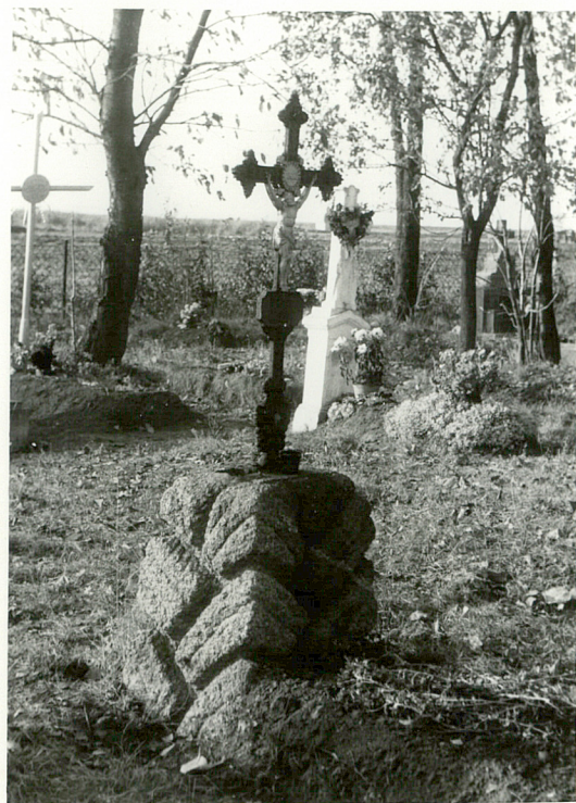
16. Krzyż żeliwny na kamiennym postumencie, napis nieczytelny, pocz. XX w.