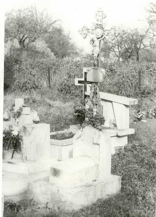
17. Krzyż żeliwny na betonowym postumencie, napis nieczytelny, pocz. XX w.