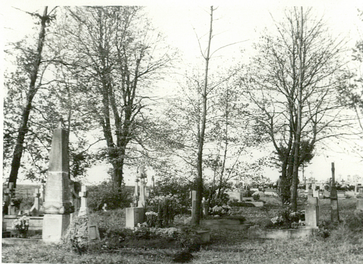
2. Widok ogólny cmentarza.