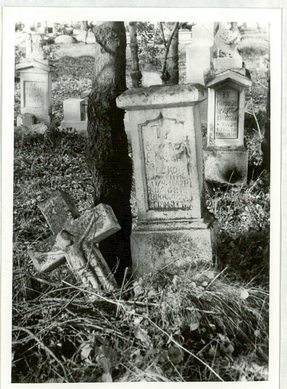
7. Nagrobek kamienny, nazwisko nieczytelne, zm. 1911r.