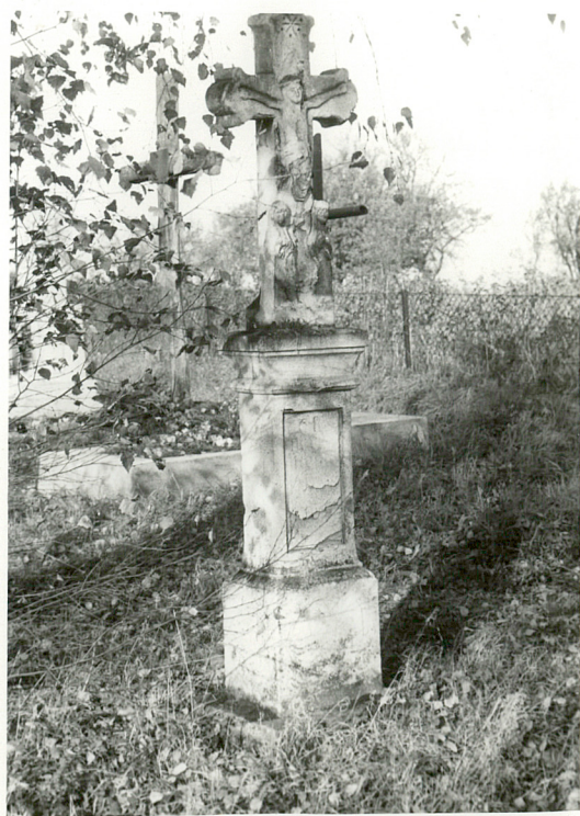
10. Nagrobek kamienny, napis nieczytelny, pocz. XXw.