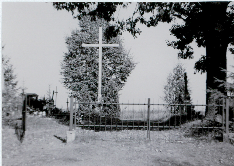
I. Widok bramy głównej