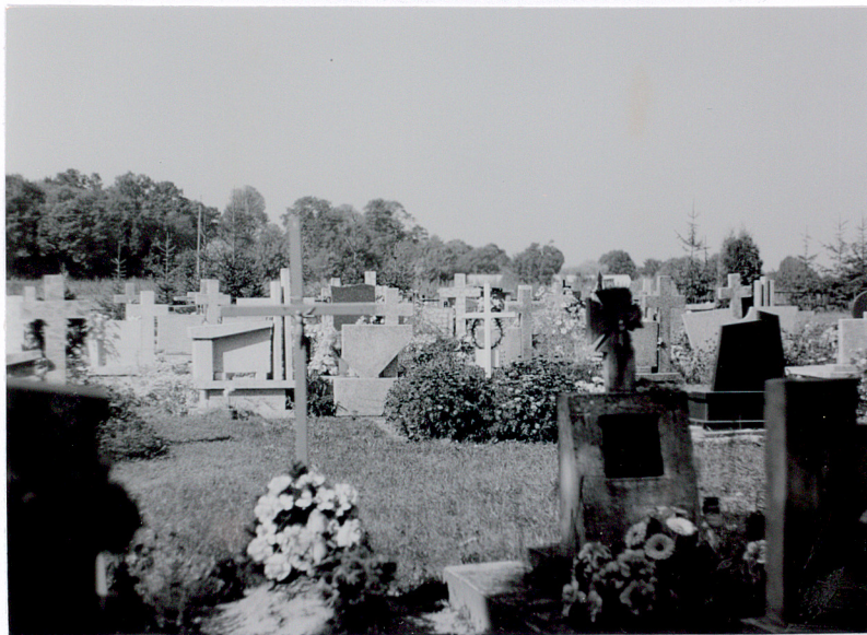
5. Widok na część nową cmentarza