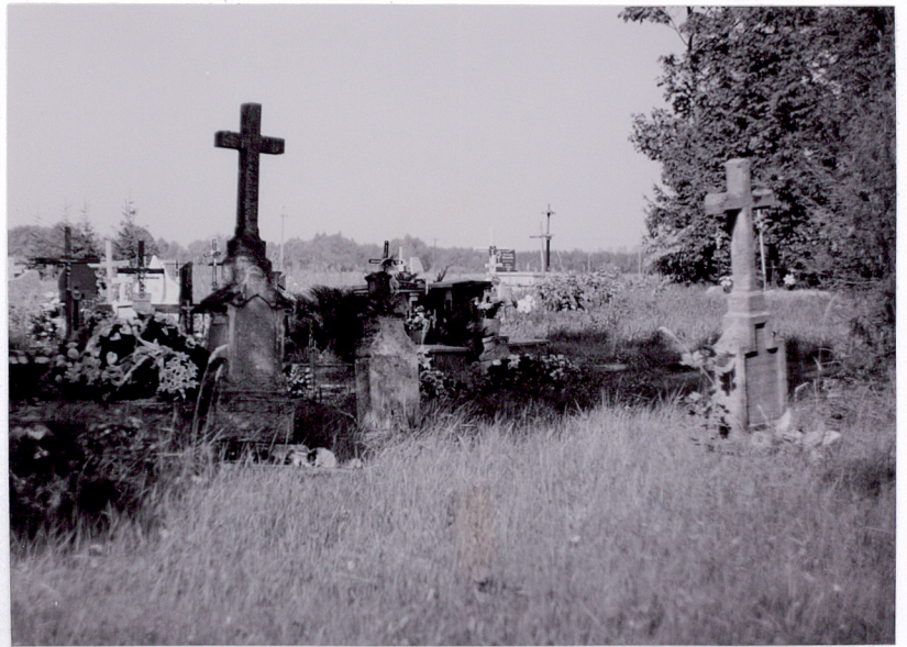
4. Grupa nagrobków z pocz. XXw.