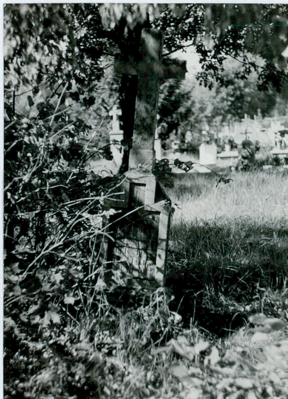
2. Nagrobek kamienny, Iwan Fiedon, 1915 r.