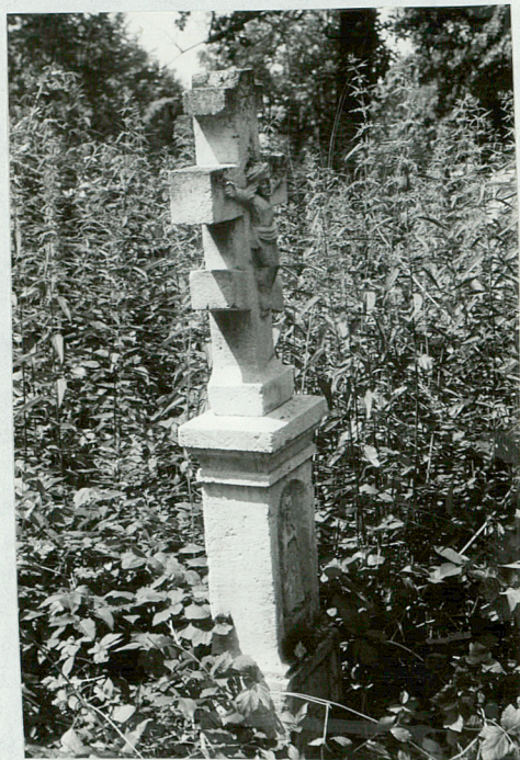
13. Krzyż kamienny pocz. XXw.