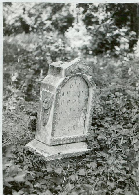
10. Nagrobek kamienny pocz. XX w.