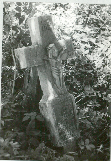
3. Krzyż kamienny z 1877 roku