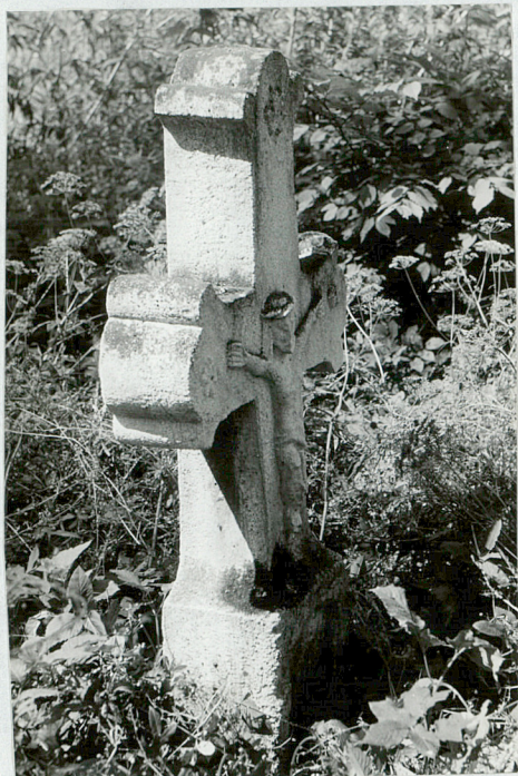
9. Krzyż kamienny 1906 r.