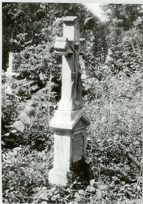
7. Krzyż kamienny 1903 r.