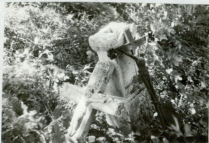
11. Nagrobek Kamienny i krzyż żeliwny pocz. XXw.