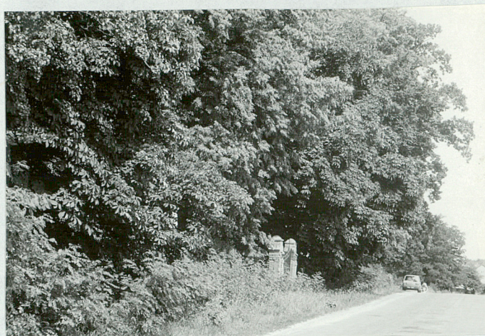
14. Widok na bramę cmentarza od strony zachodniej