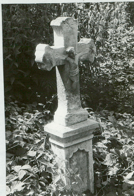
2. Krzyż kamienny z 1880 roku