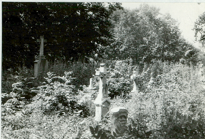
6. Widok ogólny cmentarza od strony wschodniej