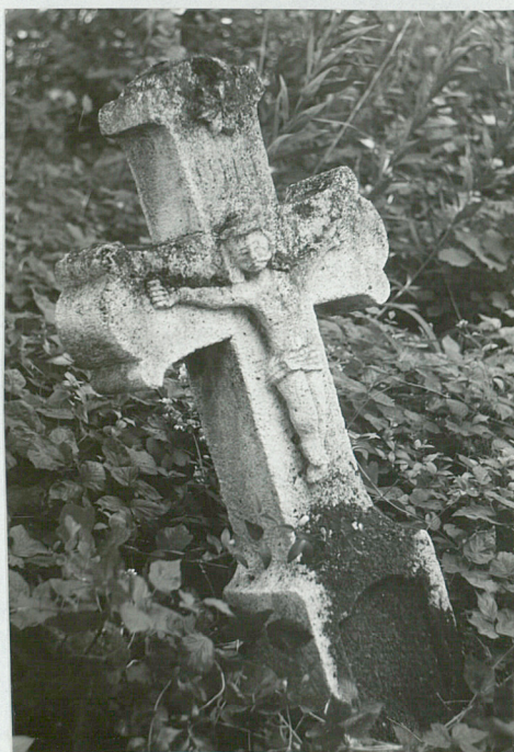
4. Krzyż kamienny XIX XX w.