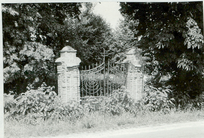
1. Brama cmentarza widok od strony drogi