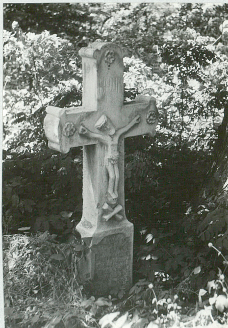
8. Krzyż kamienny pocz. XX w.