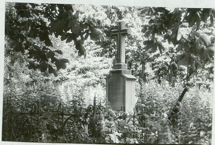
5. Nagrobek kamienny zm. Filimon Podoliński dziekan jarosławski paroch w Łazach 1912 r.