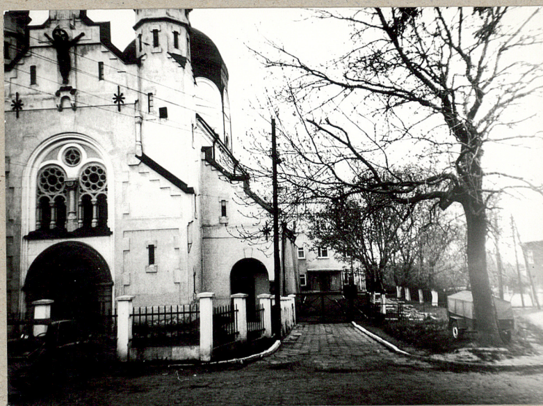
b. Widok ogólny