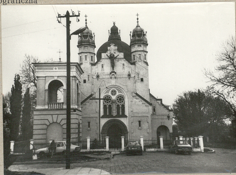
a. Widok ogólny