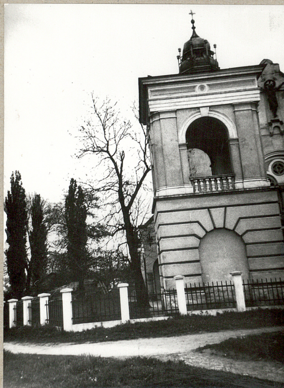
c. Widok ogólny