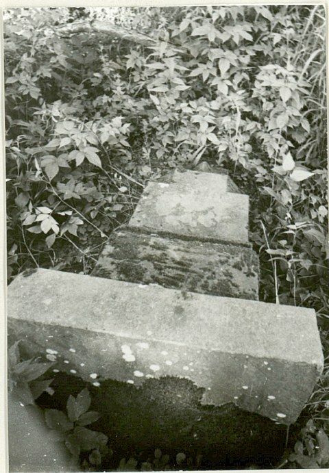
3. Nagrobek kamienny uszkodzony z pocz. XX w. /napisów brak/