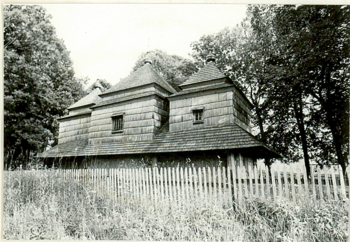
6a. Cerkiew drewniana