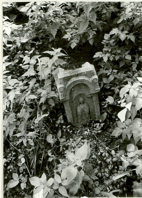
2. Nagrobek kamienny uszkodzony z pocz. XX w. /napisów brak/