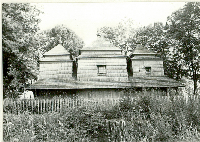
6. Cerkiew drewniana