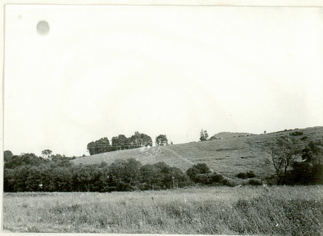
7. Widok z drogi.