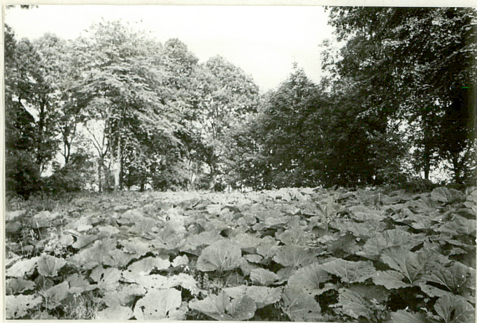
5. Widok ogólny