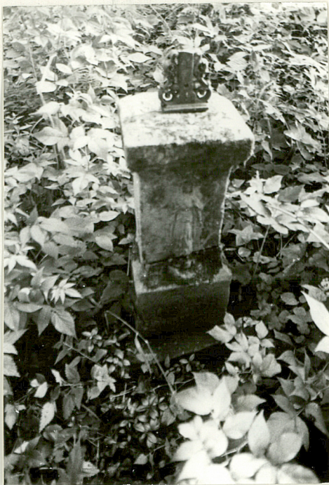
1. Nagrobek z krzyżem żel. uszkodzony z pocz. XX w. /napis nieczytelny/