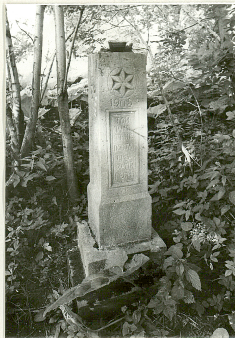
4. Nagrobek kamienny z 1908r.