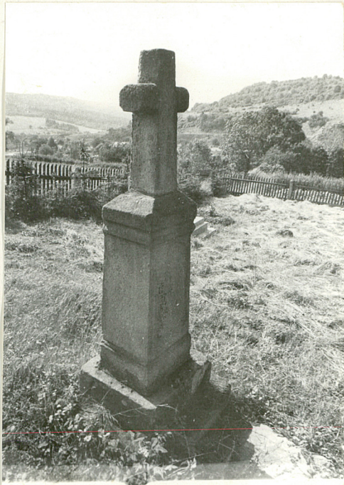
1. Nagrobek kamienny z k. XIX w. (napisów brak)