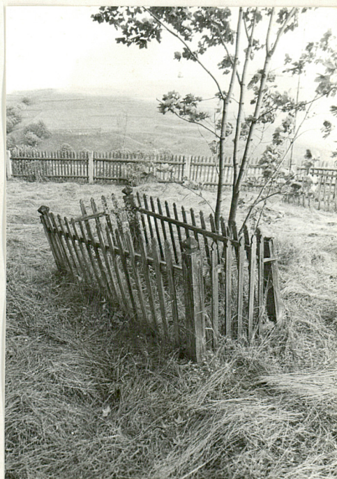
4. Mogiła z drewnianym ogrodzeniem z pocz. XX w. (napisów brak)