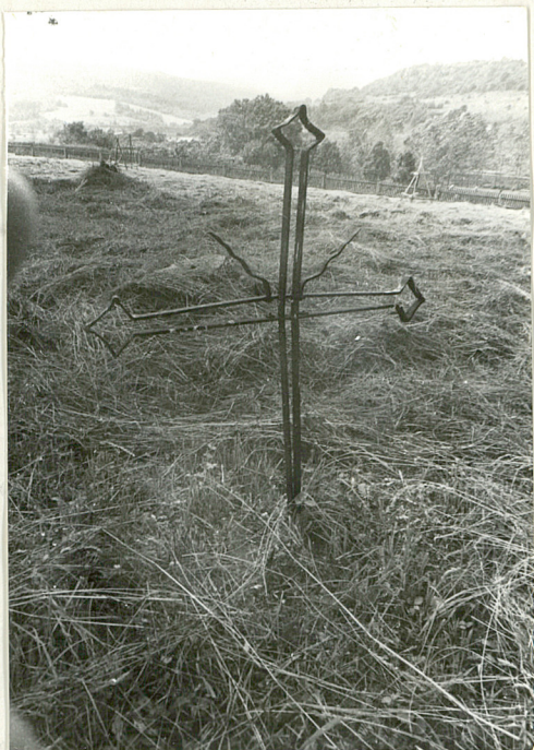
5. Mogiła z krzyżem żelaznym z pocz. XX w. (napisów brak)