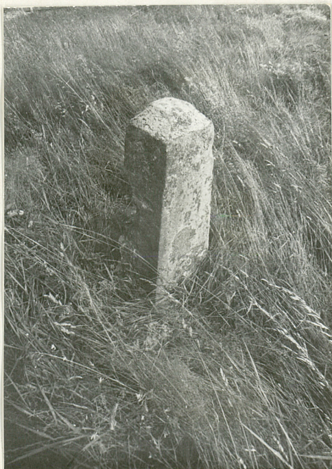
3. Nagrobek kamienny uszkodzony z pocz. XX w. (napisów brak)