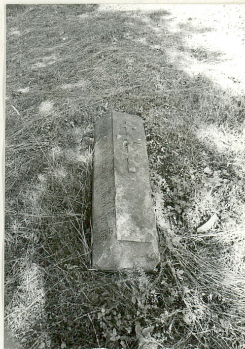
8. Płyta nagrobna z 1908r.