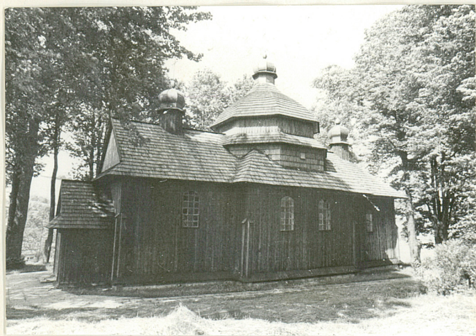
7. Cerkiew drewniana