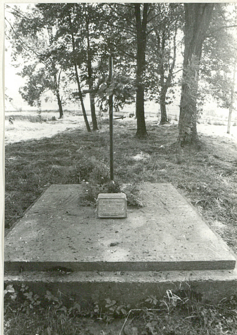
6. Mogiła zbiorowa mieszkańców wsi zamordowanych w okresie wojny