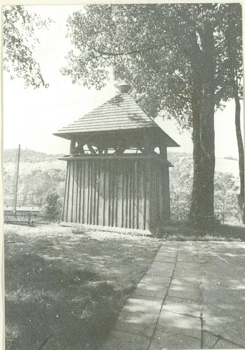
9. Dzwonnica drewniana