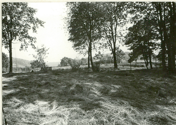
10. Widok ogólny