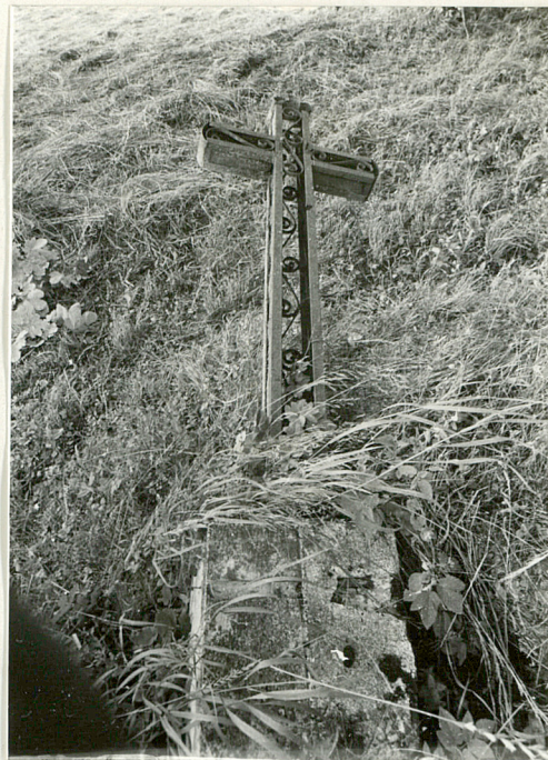
2. Przewrócony nagrobek z krzyżem żelaznym z pocz. XX w. (napisów brak)