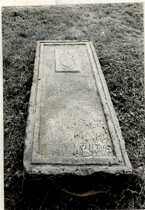
3. Płyta nagrobna z 1864r. /napis nieczytelny/