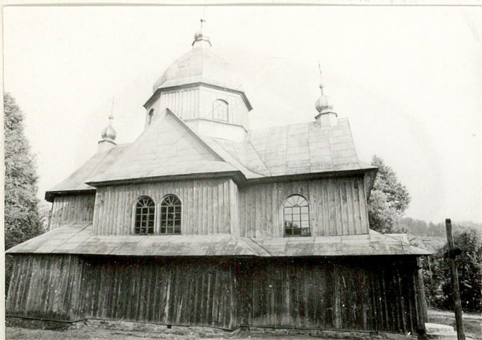
7. Cerkiew drewniana