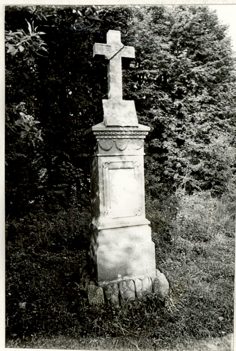
4. Nagrobek kamienny k. XIX w. /napisów brak/