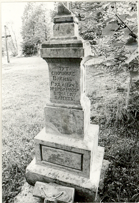
5. Nagrobek kamienny Wasil Gudanič + 1925r.