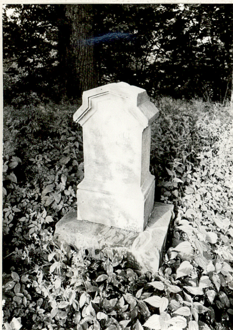
1. Nagrobek kamienny z pocz. XX w. /napis nieczytelny/