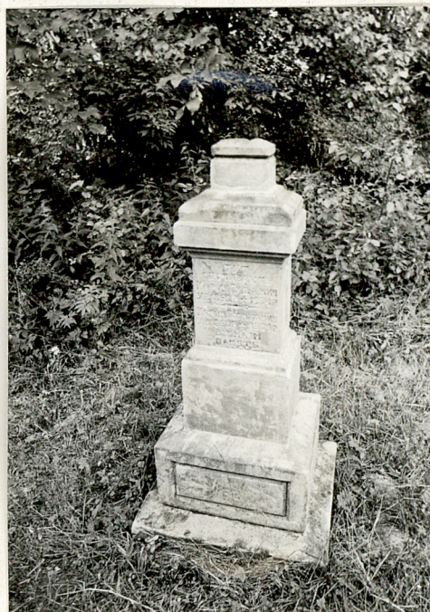
2. Nagrobek kamienny Marija Gużaczycz + 1934r.