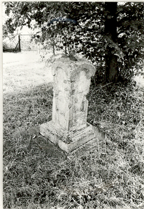
6. Nagrobek kamienny z pocz. XX w. /napisów brak/