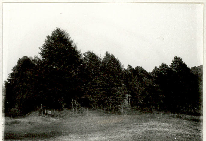
8. Widok ogólny