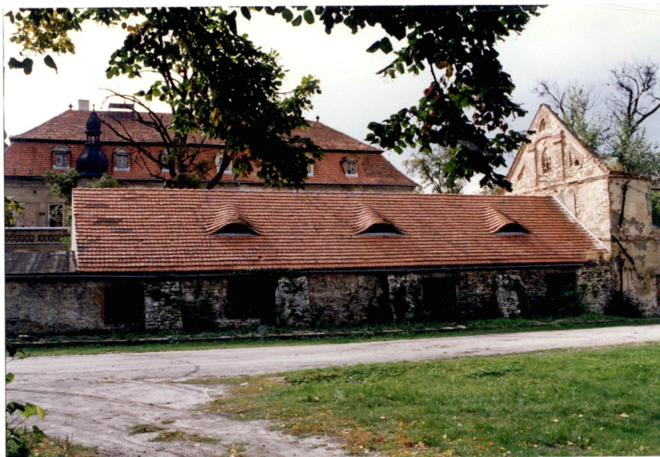
4. Dawna kuźnia od płn.- w głębi pałac, z prawej relikty d. browaru, neg. 700/595/4