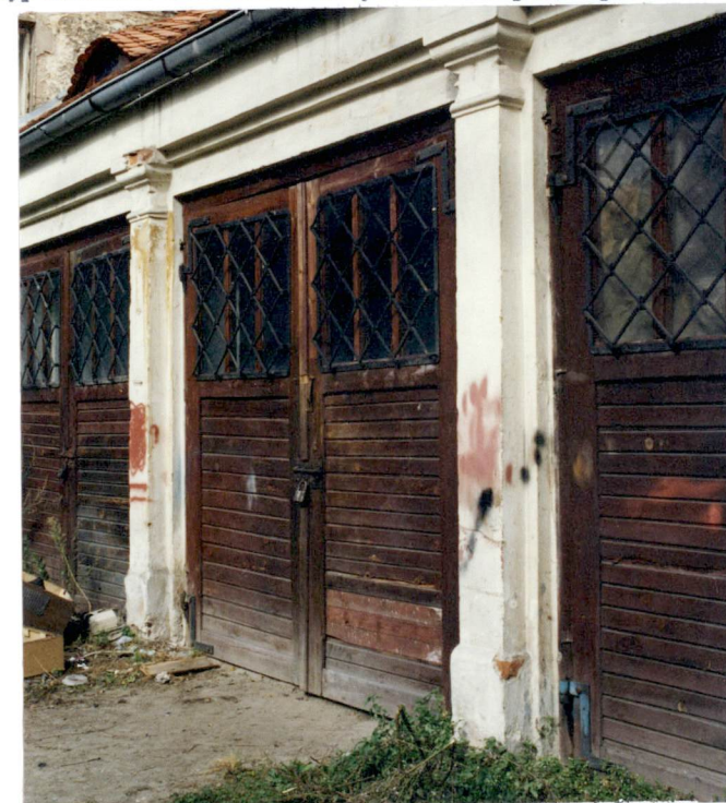
7. Wrota garażowe, neg. 700/595/6