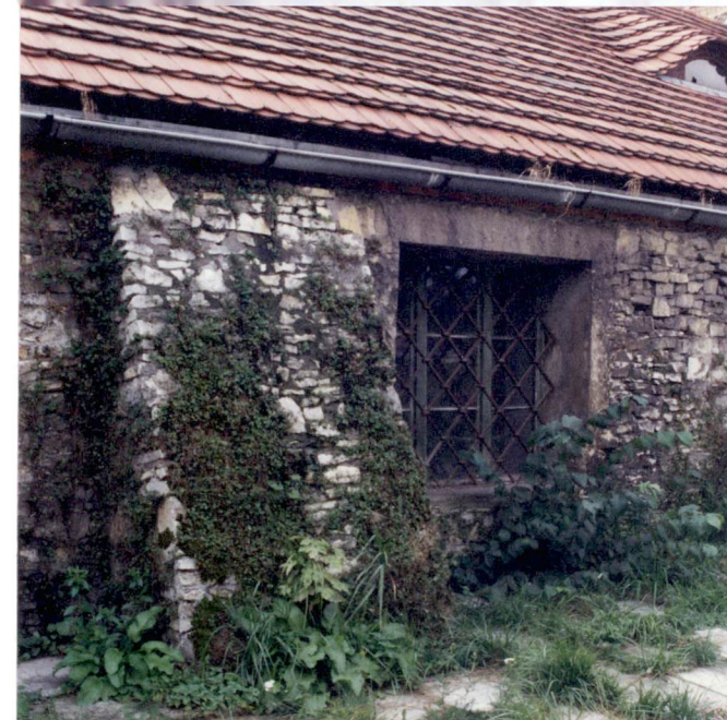
5. Przypora kamienna i otwór okienny d. kuźni od płn., neg. 700/595/5