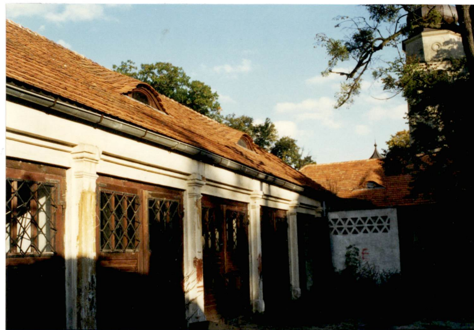
6. Elewacja płd. d. kuźni, neg. 700/700/2