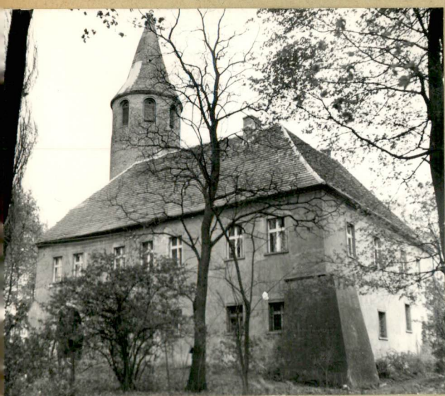
31. Szkic sytuacyjny, plan schematyczny, uwagi opisowe, fotografia