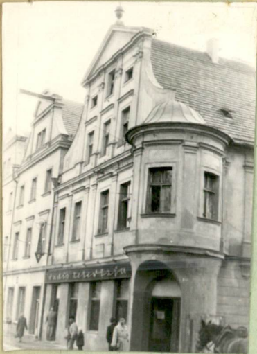
31. Szkic sytuacyjny, plan schematyczny, uwagi opisowe, fotografia