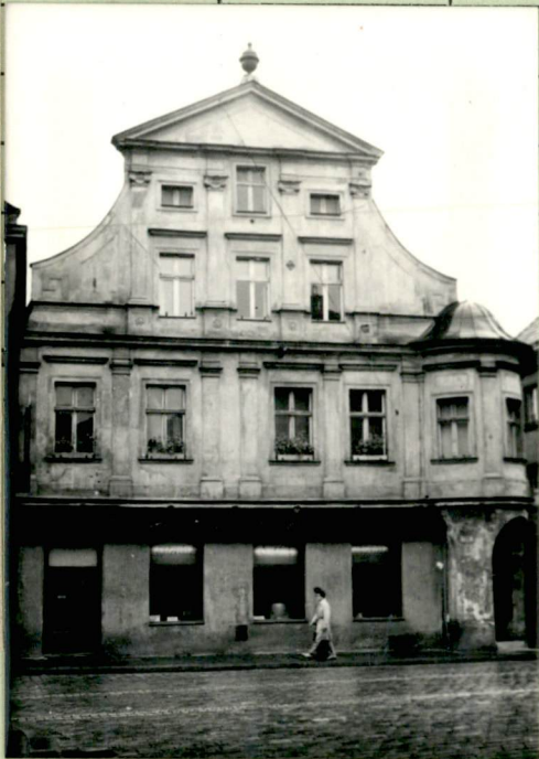
36. Wypełnił dnia