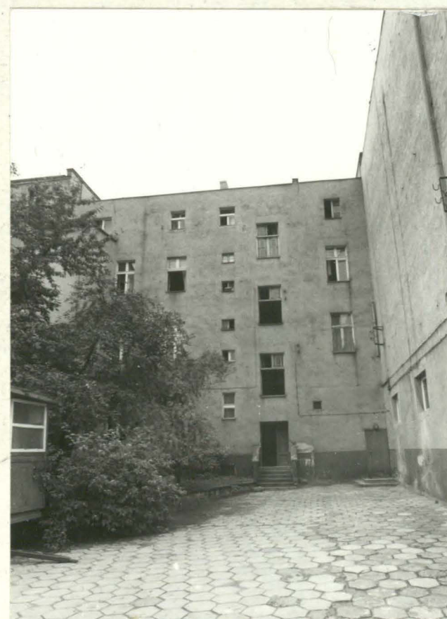
Fot. 2. Elewacja tylna.

data wykonania 1988.05.19 miejsce przechowywania negatywów