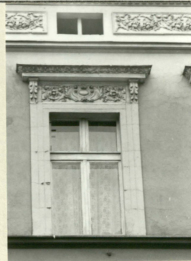
Fot. 6. Okno II p. w fasadzie.