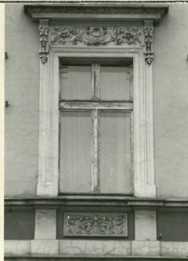
Fot. 5. Jedno z okien pięciu osi I p. w fasadzie.