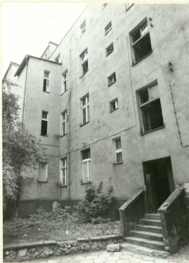
Fot. 8. Elewacja tylna. Widoczny ryzalit pionu łazienek.