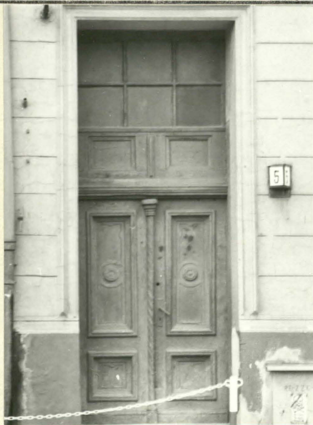
Fot. 3. Wejście do budynku w fasadzie.