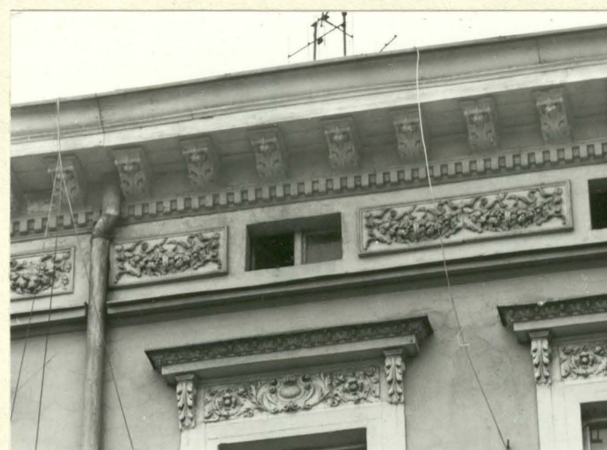
Fot. 7. Fasada, fragment zwieńczenia.