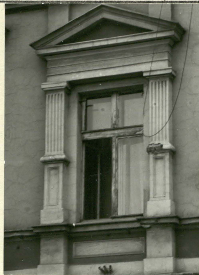
Fot. 4. Okno I p. w fasadzie.