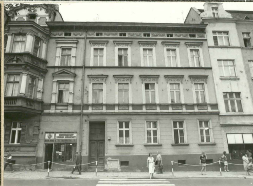
Fot. 1. Widok ogólny fasady.