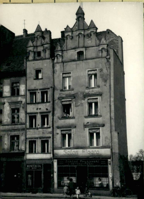
tyczny, uwagi opisowe, fotografia