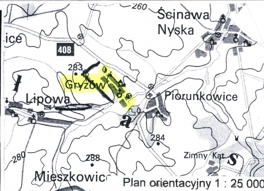
Plan orientacyjny 1 : 25 000

4. Adres 48-325 WIERZBIĘCIE POWIAT NYSKI