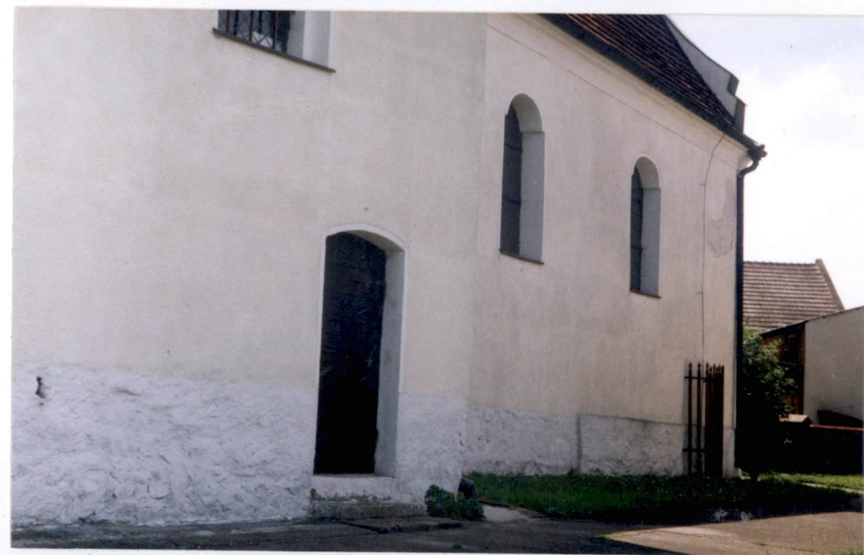
elewacja pn. – zakrystia – nawa