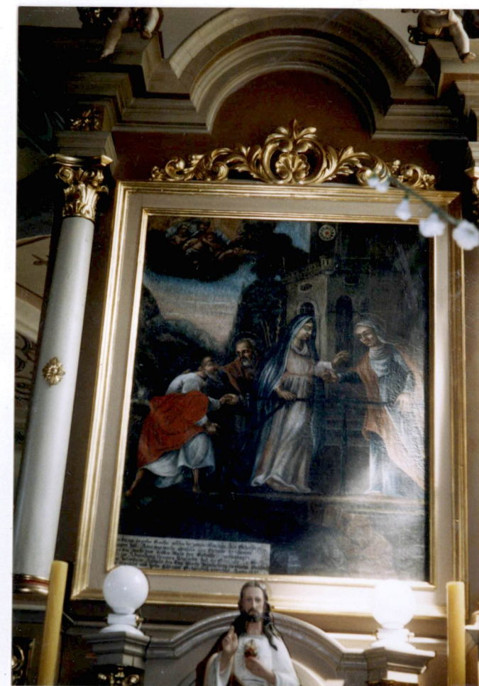
Ołtarz boczny – obraz „Nawiedzenie” – 1657 r.