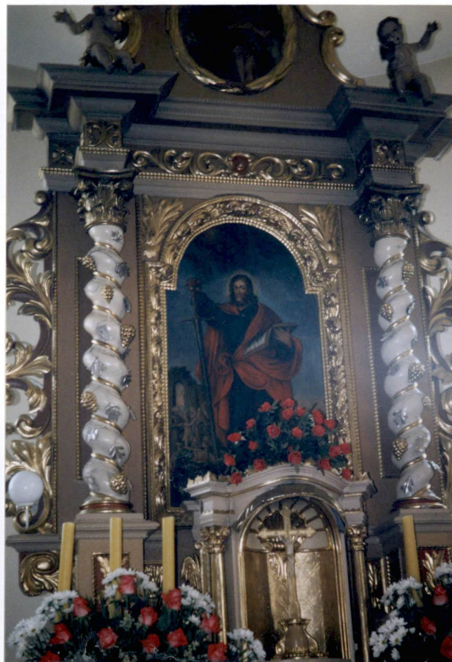
ołtarz główny - XVIIw. – obraz św. Mateusza -XVIII/ XIX w.