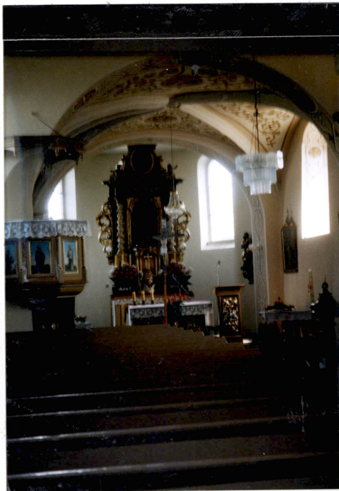
nawa główna – prezbiterium