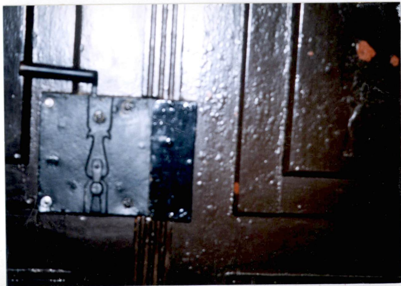
wejście główne – zamek