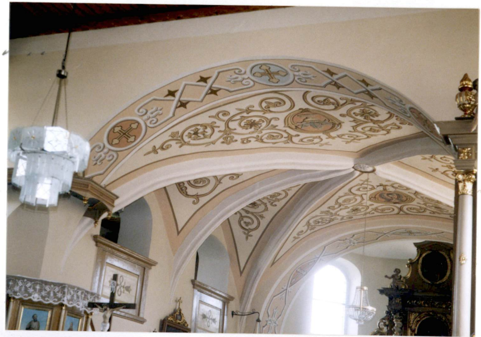
prezbiterium – sklepienie