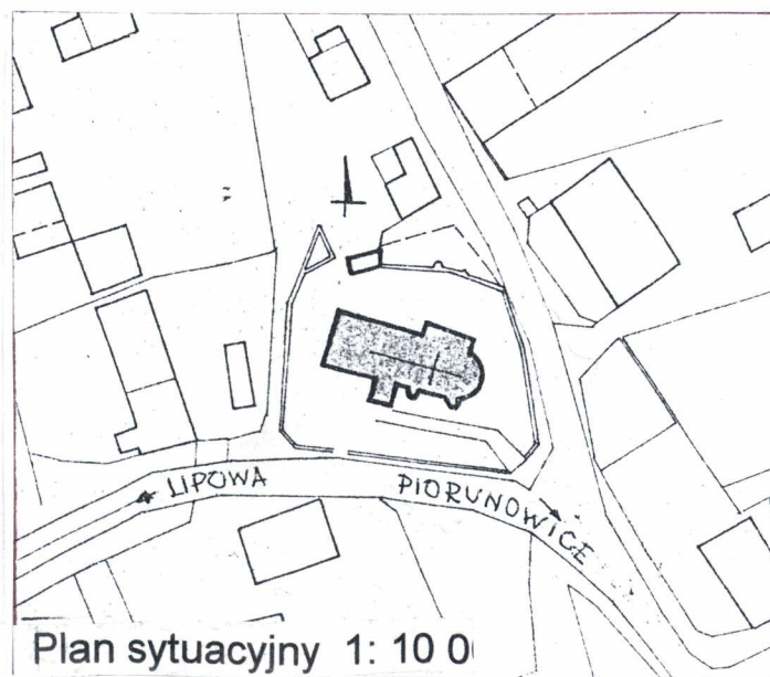
Plan sytuacyjny 1: 10 0