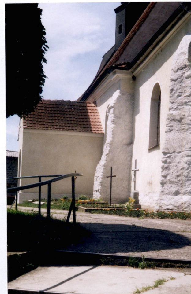
elewacja pd. - - kruchta - prezbiterium