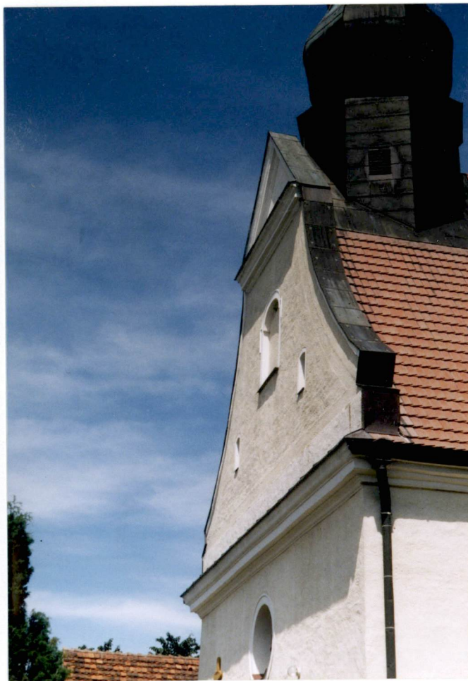
elewacja zach. – szczyt – sygnaturka