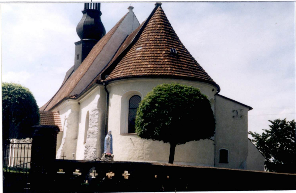
elewacja pd./wsch. – prezbiterium – zakrystia