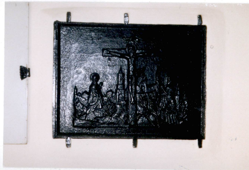
płyta żeliwna „Ukrzyżowanie” – XVI w.