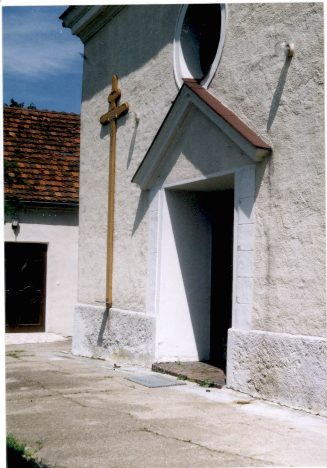
elewacja zach. Wejście główne