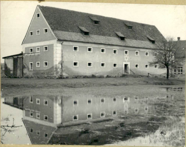
31. Szkic sytuacyjny, plan schematyczny, uwagi opisowe, fotografia

Z Y X W V U T S R P O N M L K J I H G F E D C B A Nr