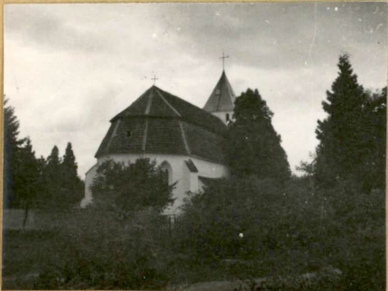
Zjednoczenie - sam. 1856, 18. 11. 57 - 12000 - kart.