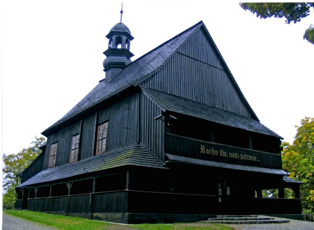
Widok od strony południowo-zachodniej