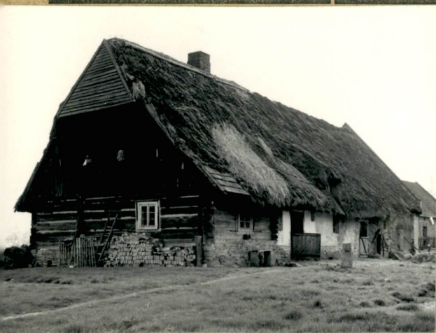
wagi opisowe, fotografia