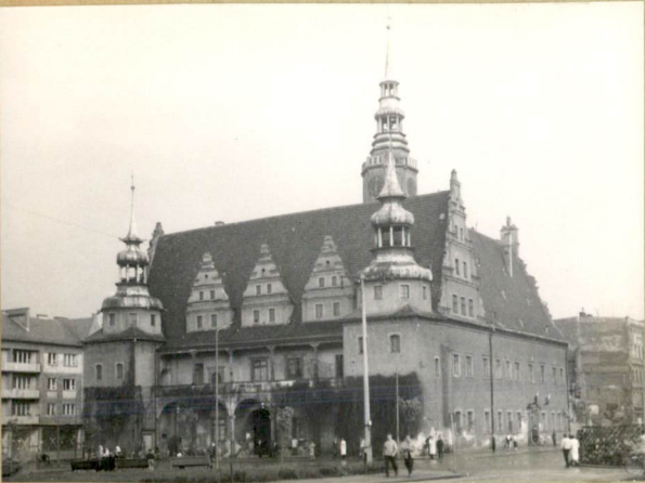
31. Szkic sytuacyjny, plan schematyczny, uwagi opisowe, fotografia