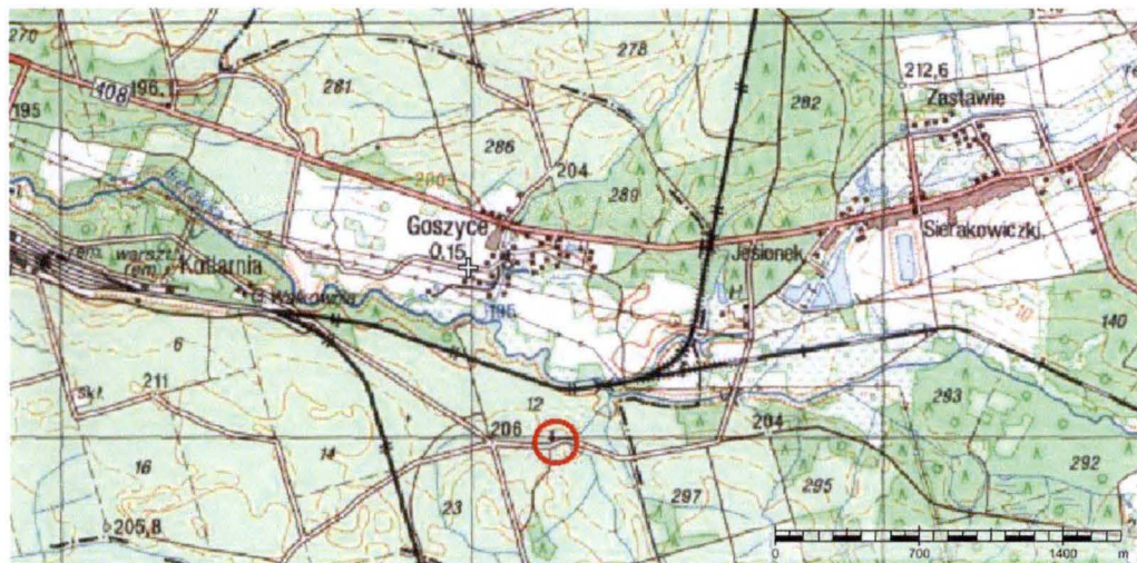
Mapa z zaznaczoną lokalizacją kaplicy.