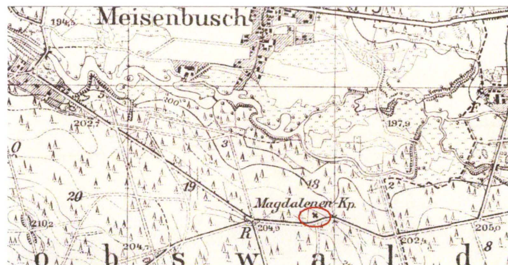
Mapa archiwalna z pocz. XX w.