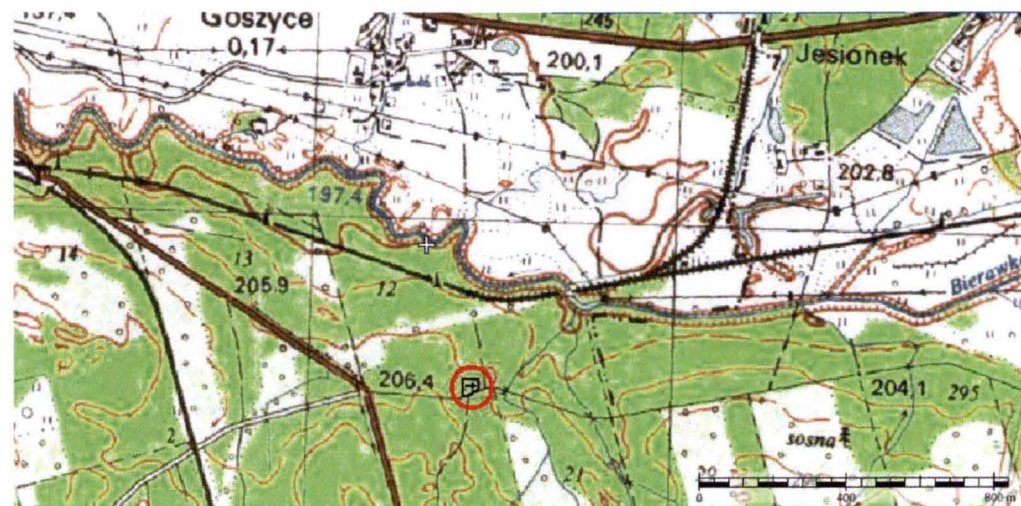
Mapa z zaznaczoną lokalizacją kaplicy.