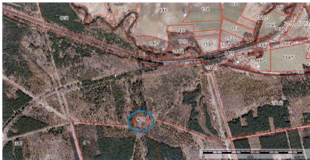
Mapa z zaznaczoną lokalizacją kaplicy.