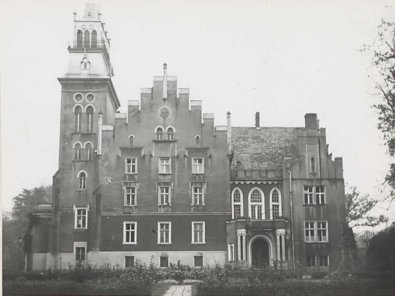
Zdj. 1, 2. Pałac - wyżej elewacja północna, frontowa. Widok od strony bramy wjazdowej.

- niżej elewacje: wschodnia z wieżą oraz południowa. Widok od strony pagórka przy stawie.