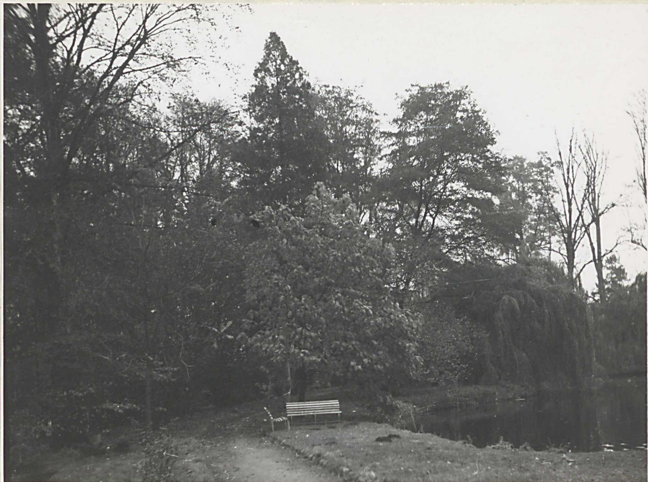
Zdj. 4. Widok na park, idąc od pałacu lewą ścieżką. Pobocza stawu miejscami mają zwarty drzewostan, kontrastujący ze świetlistym otoczeniem przy pałacu.