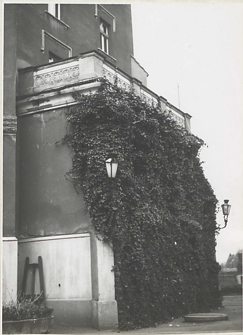
Zdj. 6. Dorodny bluszcz pospolity, przy wschodnim "ganku". Widok od strony południowej.