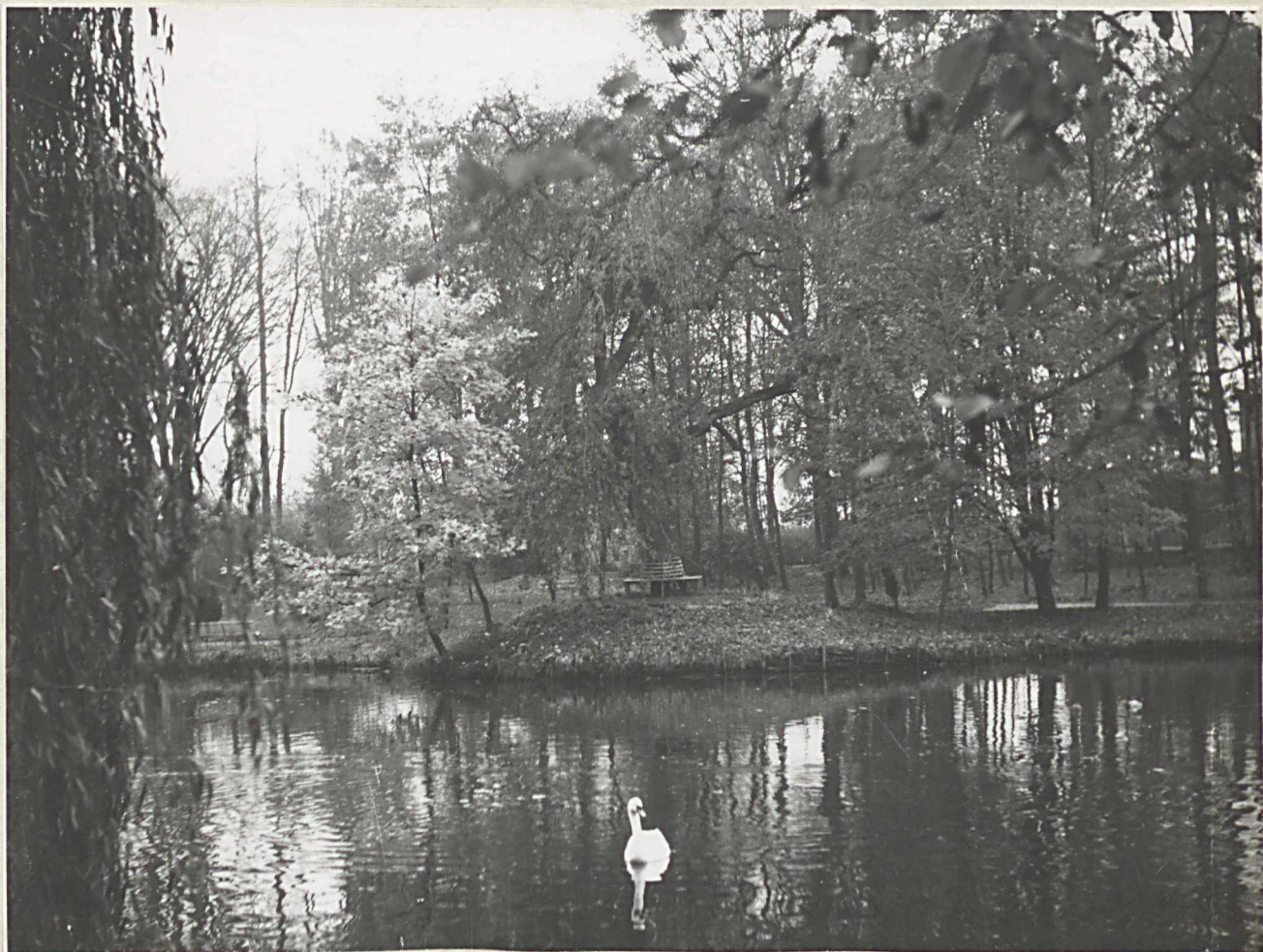
5. Widok na staw od strony pałacu. Na dalszym planie pagórek z jesionem zwisłym, otoczonym ławą wypoczynkową.