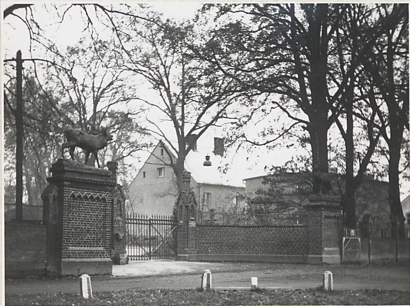
Zdj. 3. Wjazd do parku, przed fronton pałacu.

Na cokołach bramnych widoczne są jelenie /odlewy/.