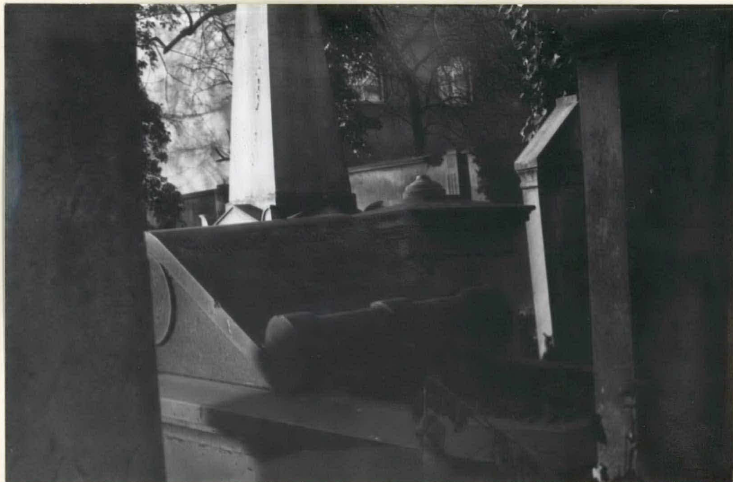
Fot.nr 2 Jeden z ciekawszych nagrobków wykonany z czerwonego marmuru.