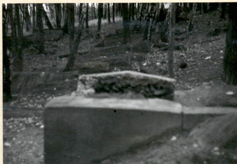
Wnętrze cmentarza część pn.