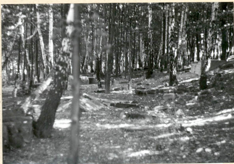
Wnętrze cmentarza część pn-wsch.