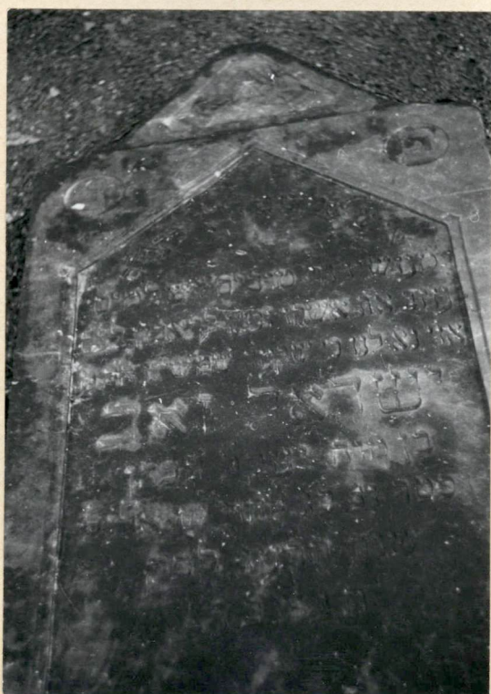
Tablica nagrobna w części pn-zach.