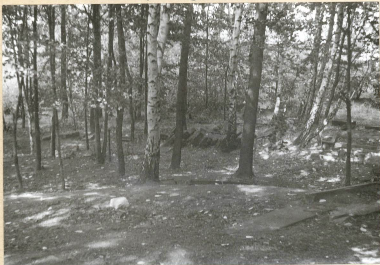
Wnętrze cmentarza część pn-zach.