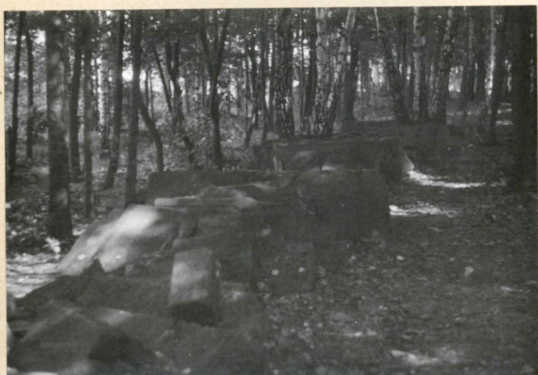
Wnętrze cmentarza część pn-wsch.