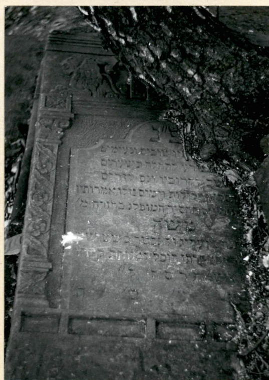
Tablica nagrobna w części pn-zach.