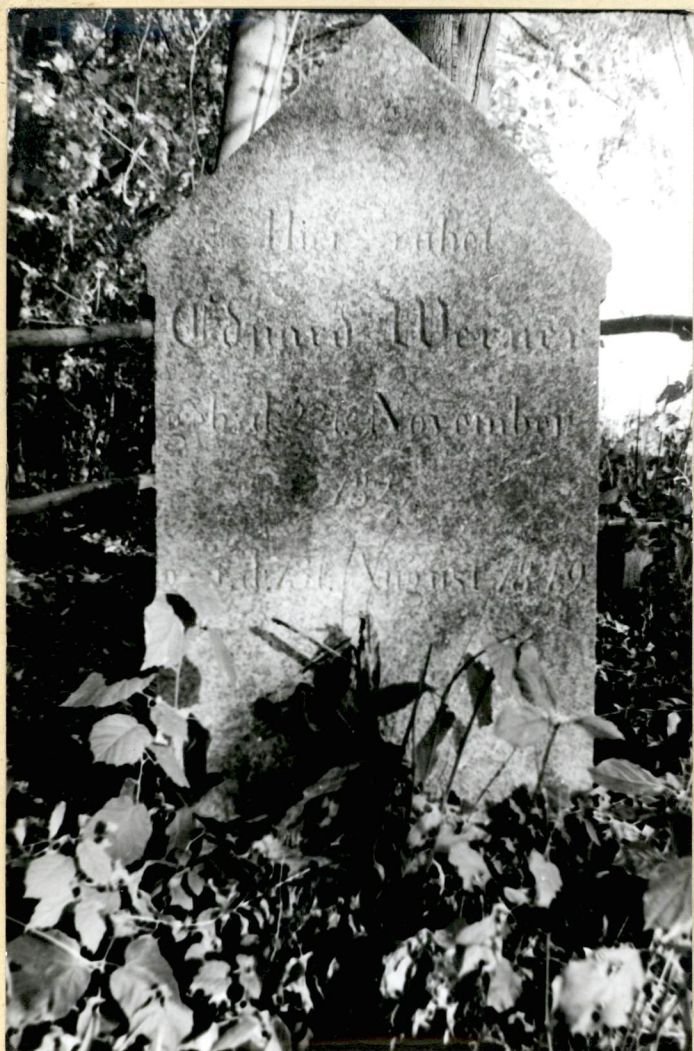
NAGROBEK Z 1819 R.