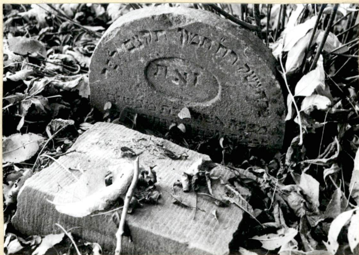
POZOSTAŁE ELEMENTY NAGROBKA