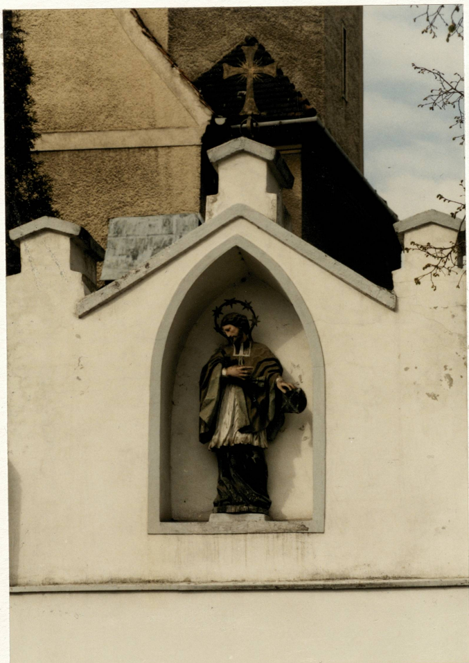
Kapliczka w murze przykościelnym, fragment