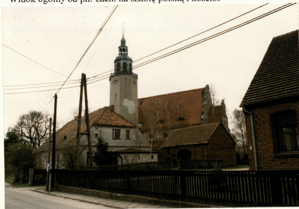
Widok ogólny od pn.-zach. na szkołę polską i kościół