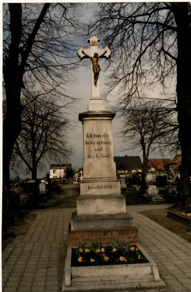
Pomnik na cmentarzu