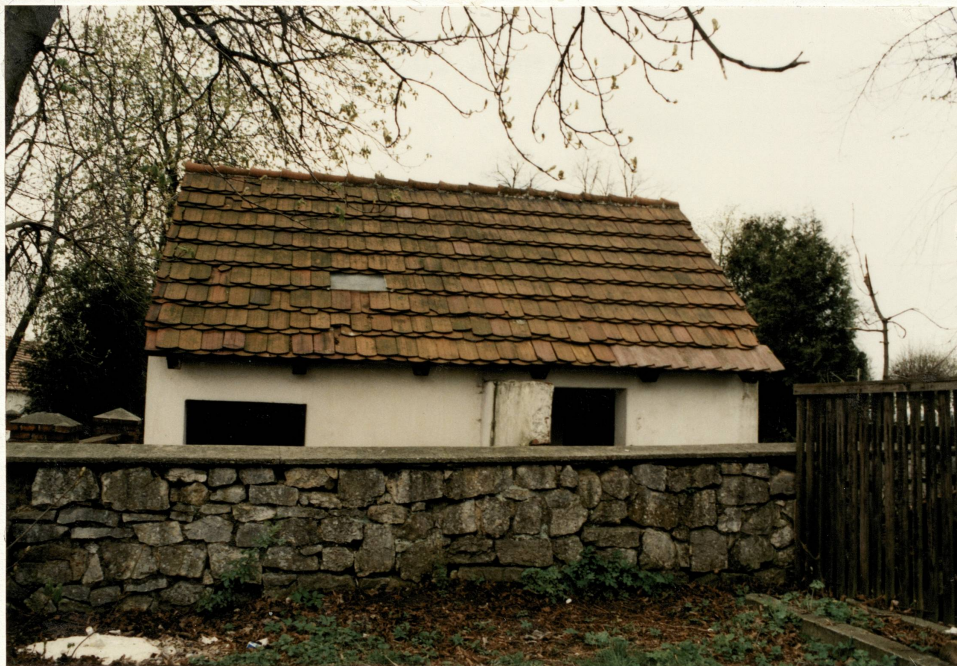
Latryna na cmentarzu – widok od pn