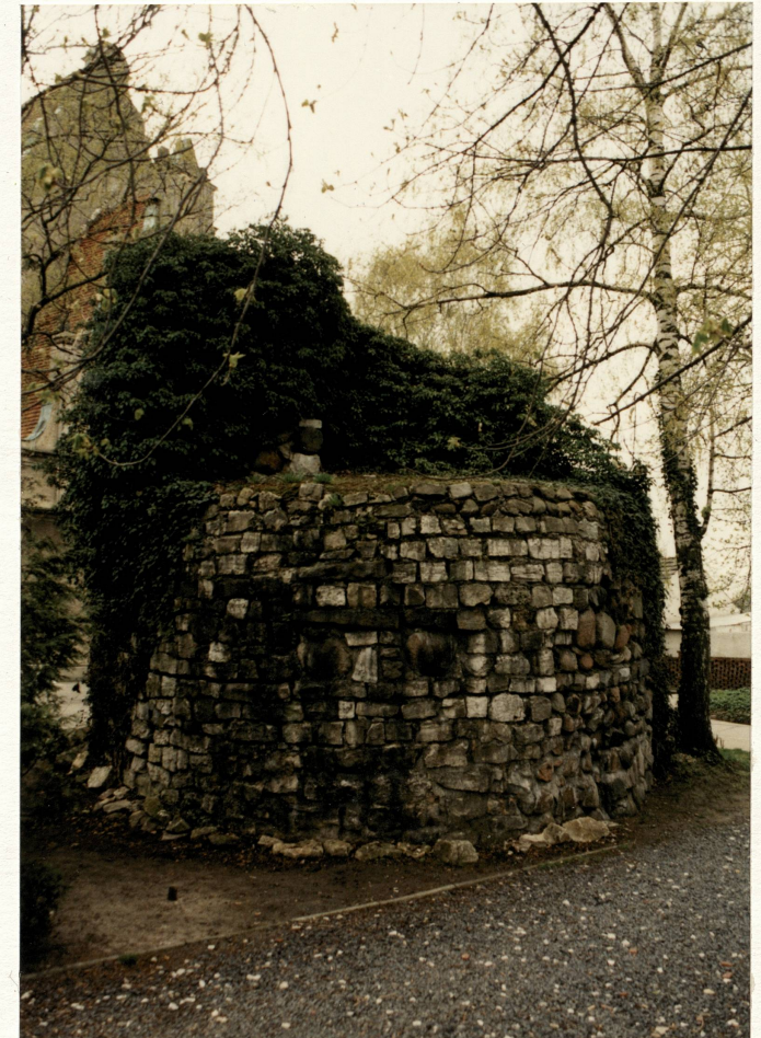
Sztuczna grota – widok od pn.