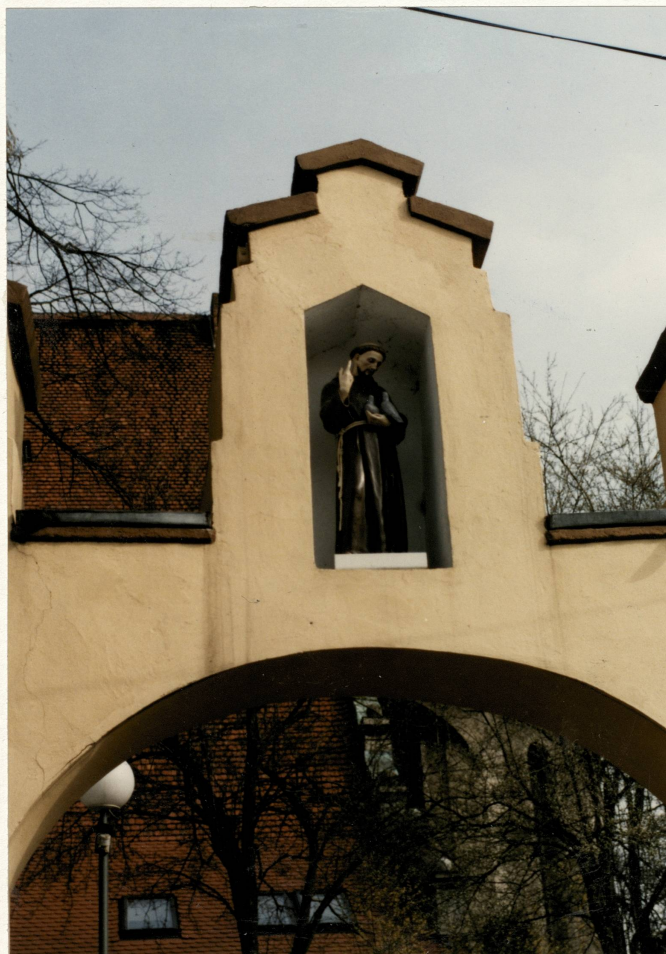
Bramka pd.-wsch. – fragment

3. Zawartość wkładki (nazwa obiektu lub materiału uzupełniającego) fotografie