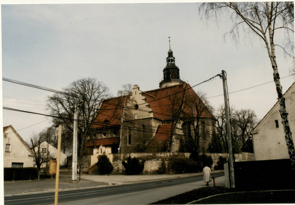
Widok ogólny od pd.-wsch.