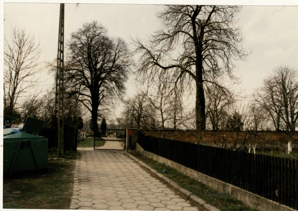
Bramka pn. cmentarza

Wkładkę założył mgr Jerzy Skarbek, kwiecień 2004 Miejsce przechowywania negatywów: u autora