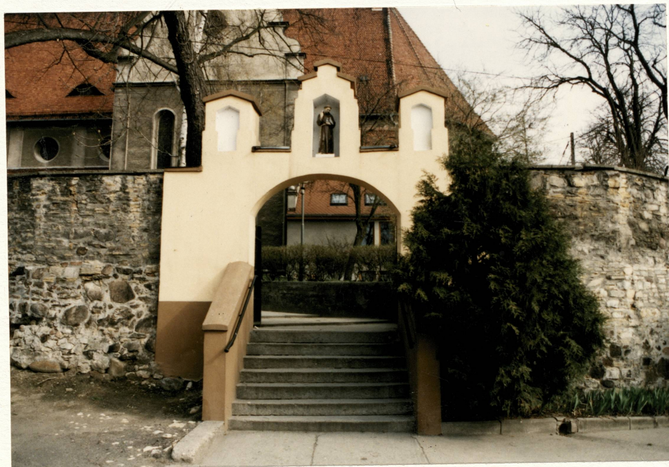
Bramka pd.-wsch. na teren przykościelny