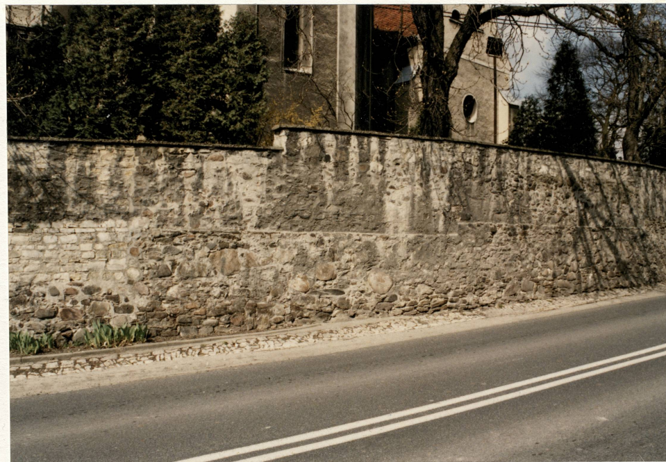
Mur wokół kościoła – fragment wsch.