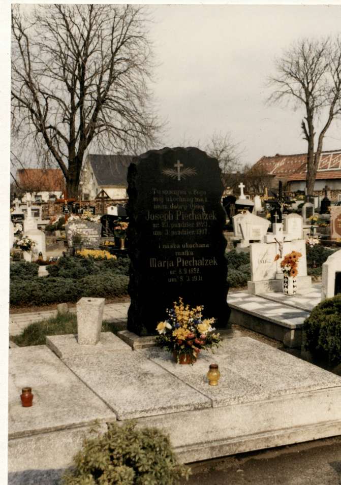
Zabytkowe nagrobki na cmentarzu

Wkładkę założył mgr Jerzy Skarbek, kwiecień 2004 Miejsce przechowywania negatywów: u autora