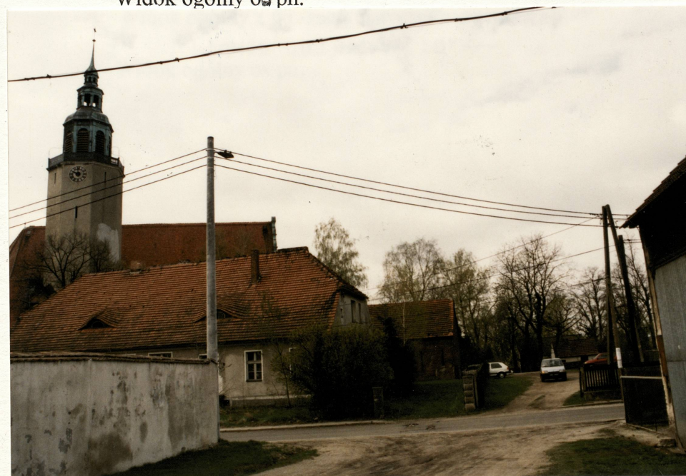
Widok ogólny od pn.