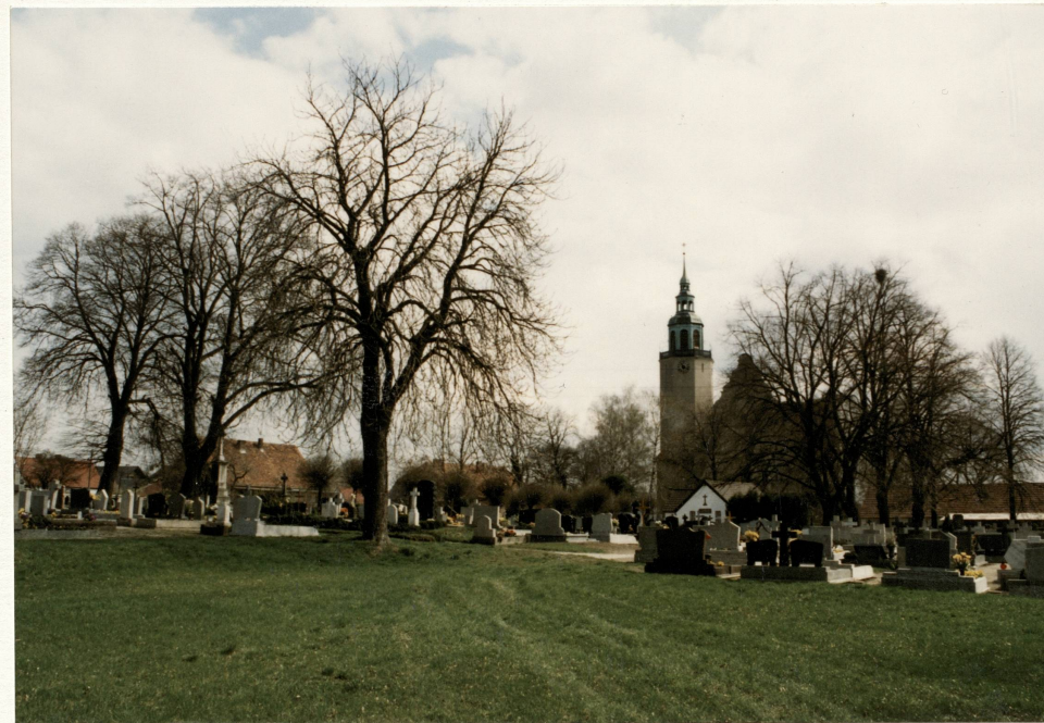
Widok ogólny z pd.-zach. narożnika cmentarza