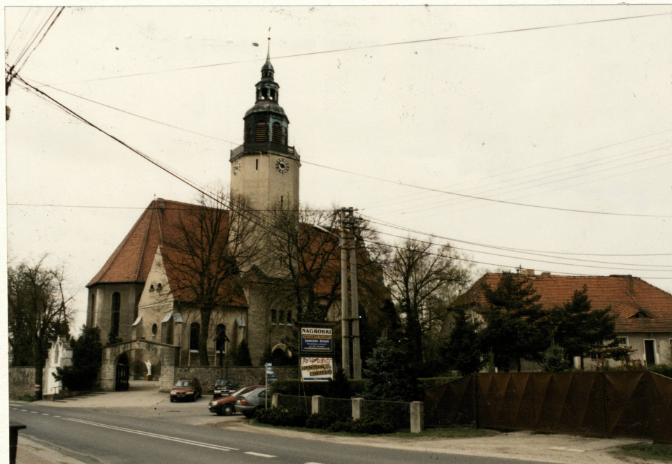
Widok ogólny od pn.-wsch. na kościół i dawną szkołę polską

3. Zawartość wkładki (nazwa obiektu lub materiału uzupełniającego) plan orientacyjny, fotografia, wykaz obiektów dla których założono osobne karty, dokończenie historii, dokończenie opisu.