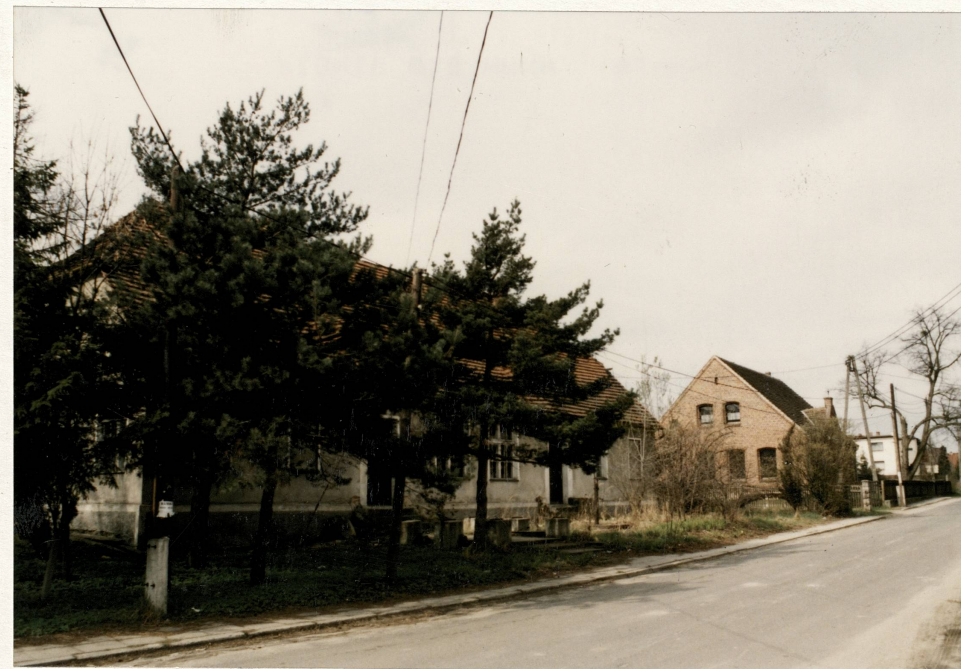
Widok od pn.-wsch. na szkołę polską i niemiecką