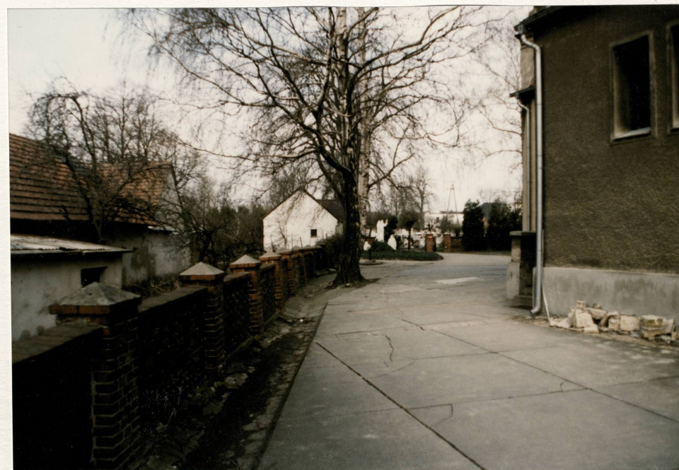
Widok od wsch. z terenów przykościelnych w kierunku cmentarza