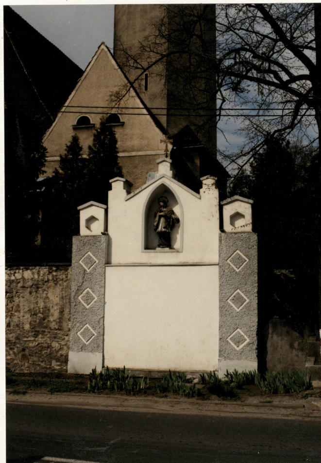
Kapliczka w murze przykościelnym , Widok od wsch.