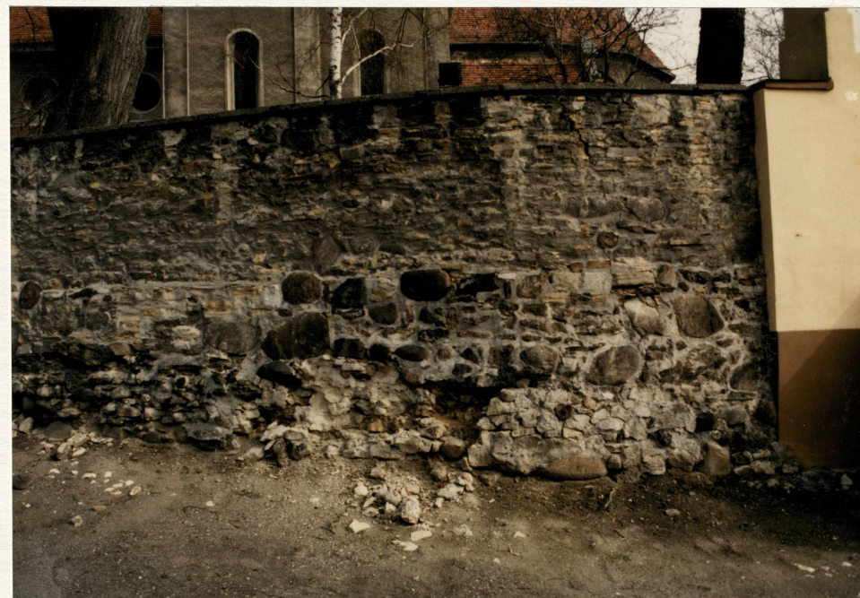
Mur wokół kościoła – fragment przy bramce pd.-wsch.