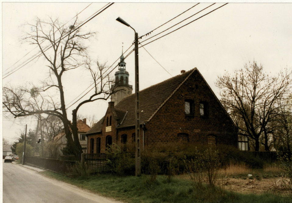
Widok od pn.-zach. na szkołę niemiecką i polską

3. Zawartość wkładki (nazwa obiektu lub materiału uzupełniającego) fotografie