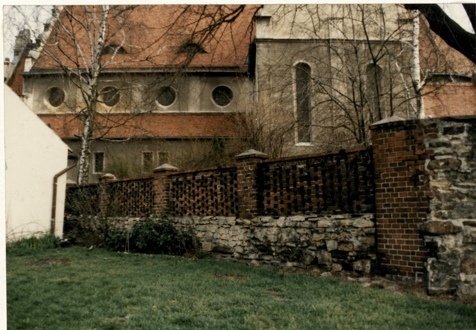
Pd.-zach. odcinek muru przy kościele

3. Zawartość wkładki (nazwa obiektu lub materiału uzupełniającego) fotografie