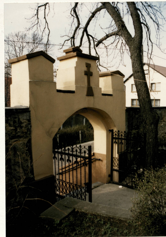
Bramka pn.-wsch. – widok od strony kościoła