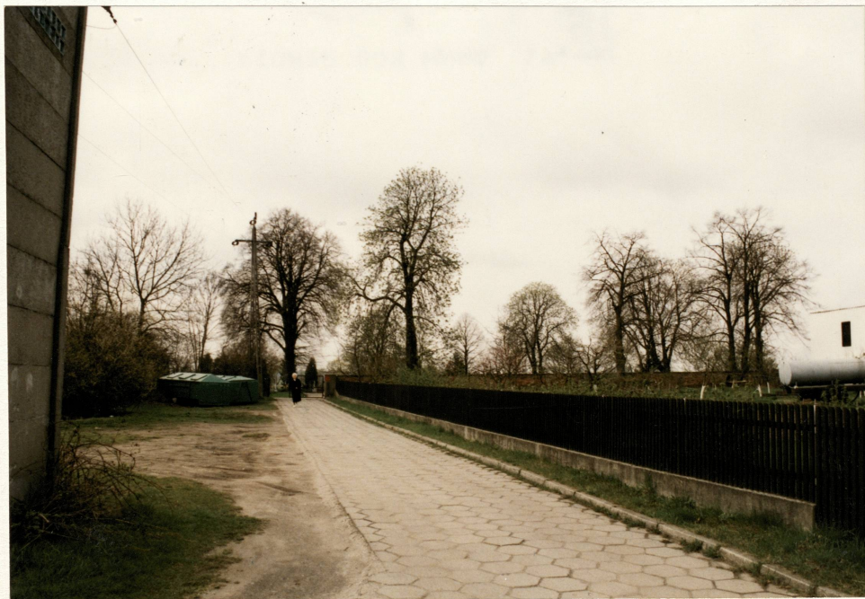
Widok od pn. w kierunku cmentarza