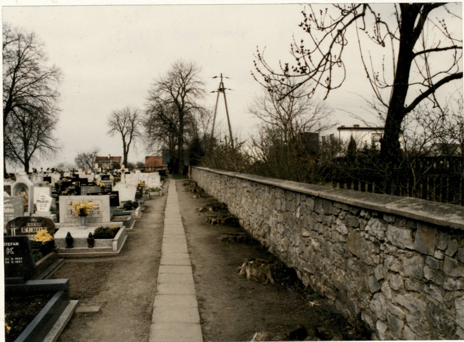
Pn. odcinek muru cmentarnego