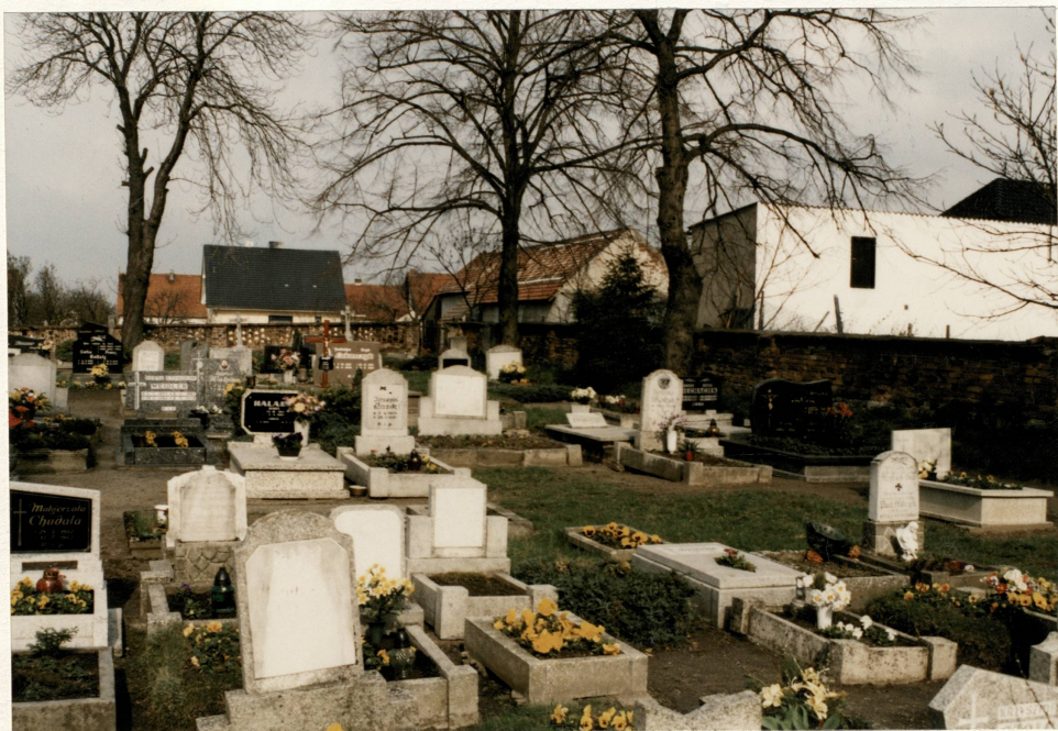
Pn. – wsch. narożnik cmentarza