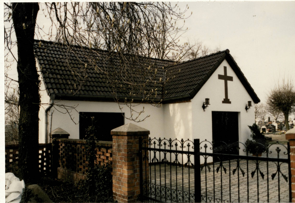
Pawilon pogrzebowy na cmentarzu – widok od