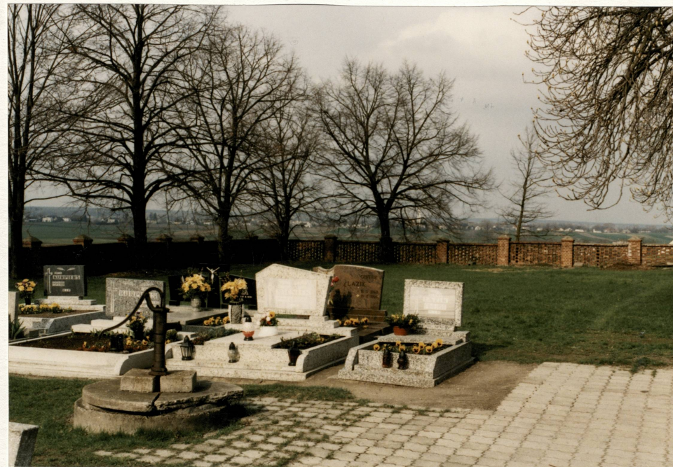
Pd.-zach. narożnik cmentarza