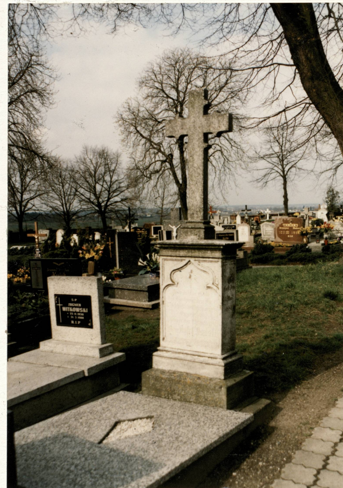
Zabytkowe nagrobki na cmentarzu