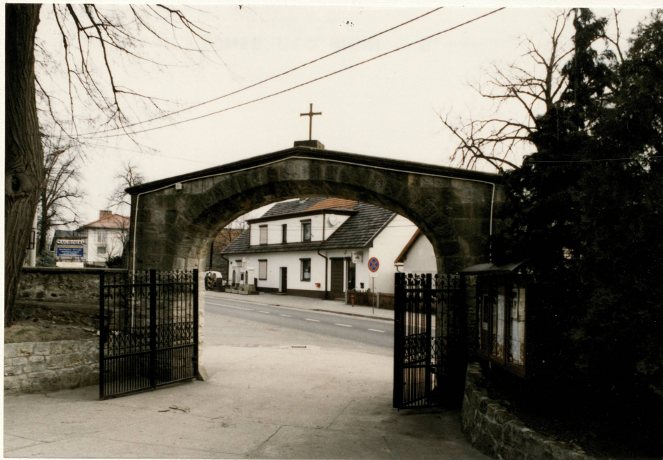
Bramka pn.-wsch. – widok od strony kościoła