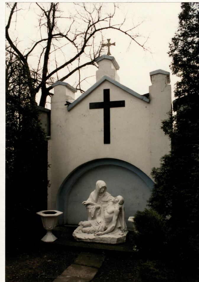
Kapliczka w murze przykościelnym, widok od strony kościoła