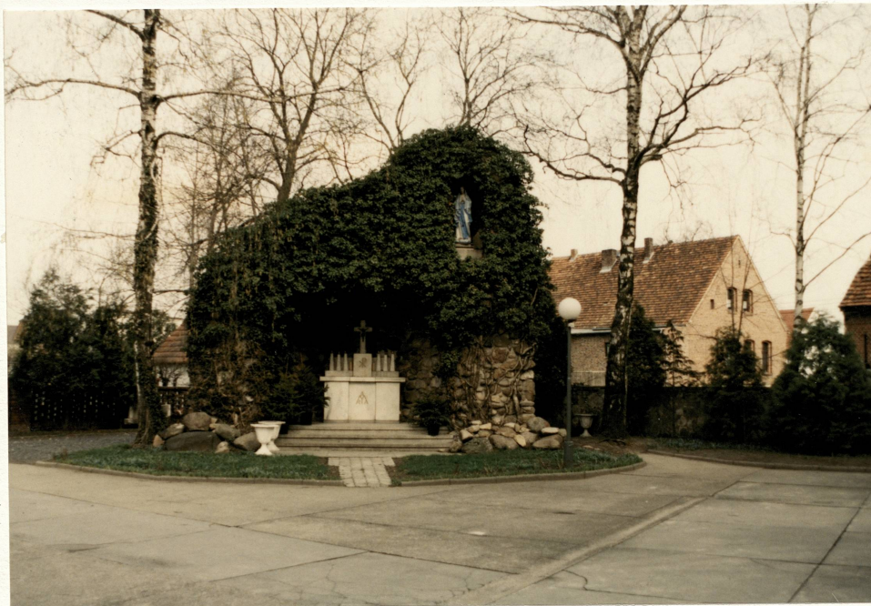
Sztuczna grota z ołtarzem – widok od pd.-wsch.

3. Zawartość wkładki (nazwa obiektu lub materiału uzupełniającego) fotografie