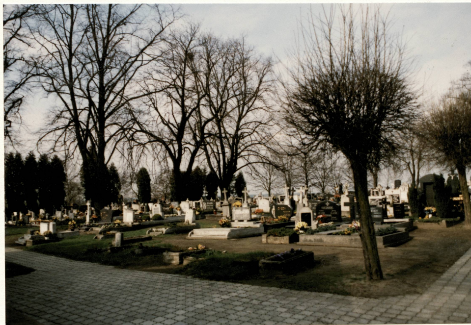
Widok na cmentarz w kierunku pd.-zach.