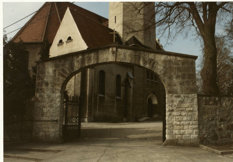
Bramka pn.-wsch. w murze wokół kościoła