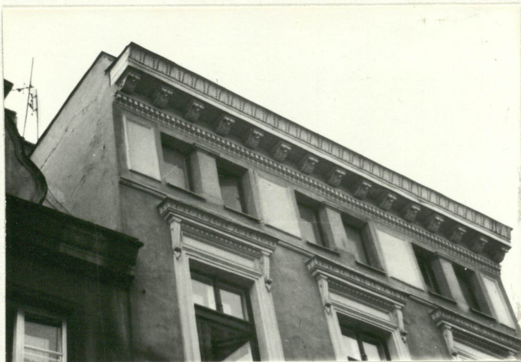
IV kondygnacja, zwieńczenie