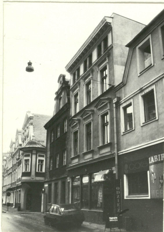
Widok od pn.-wsch.