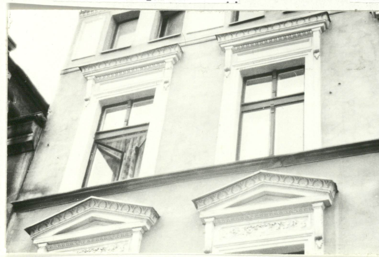
Okno III kondygnacji