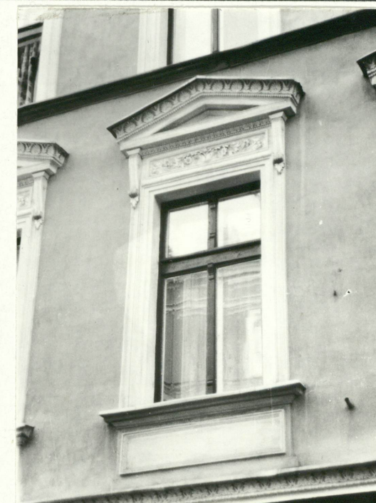
Okno II kondygnacji