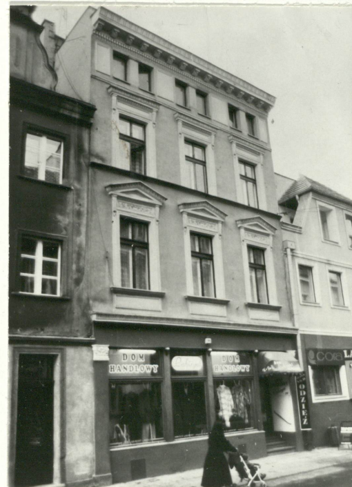
Widok od pd.-wsch.