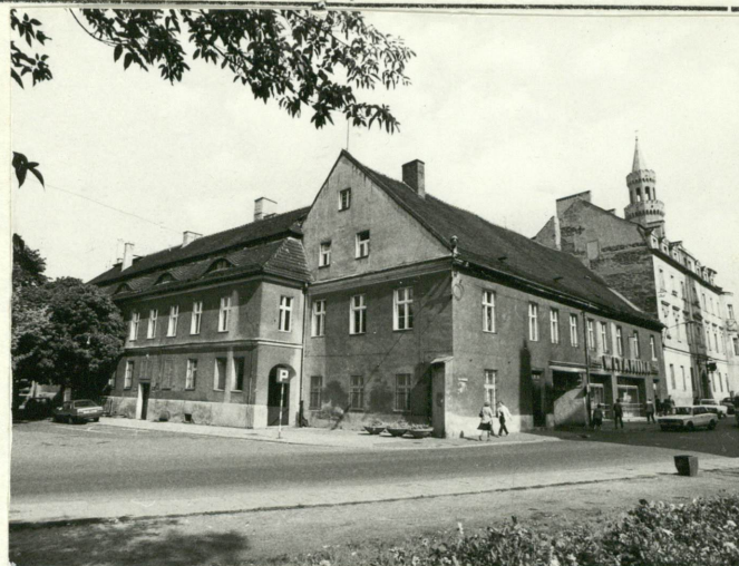
Fot. 1. Widok ogólny od południa.