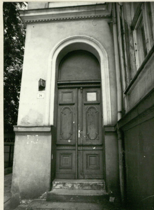
Wejście do budynku w ryzalicie z boku budynku.