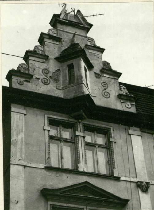
Fasada - fragment górnej części ze szczytem.