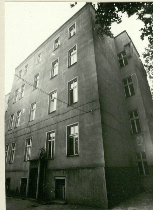
Elewacja tylna - widok ogólny od NE.