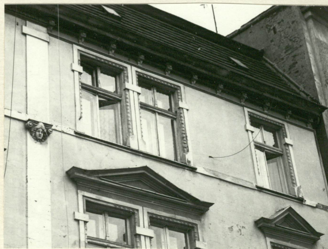
Fasada - fragment zwieńczenia po stronie prawej.

Wkładkę założył: 1986.08.26 (Imię, nazwisko, data)