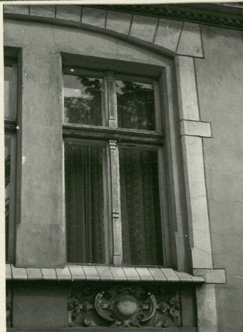
Fasada - okno parteru.