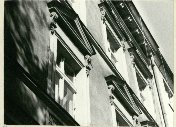
Fasada - głębokości gzymsów, obdaszniki i gzymsu wieńczącego.