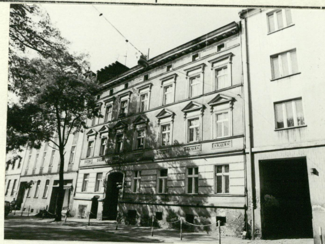
Fasada / elewacja południowa/.