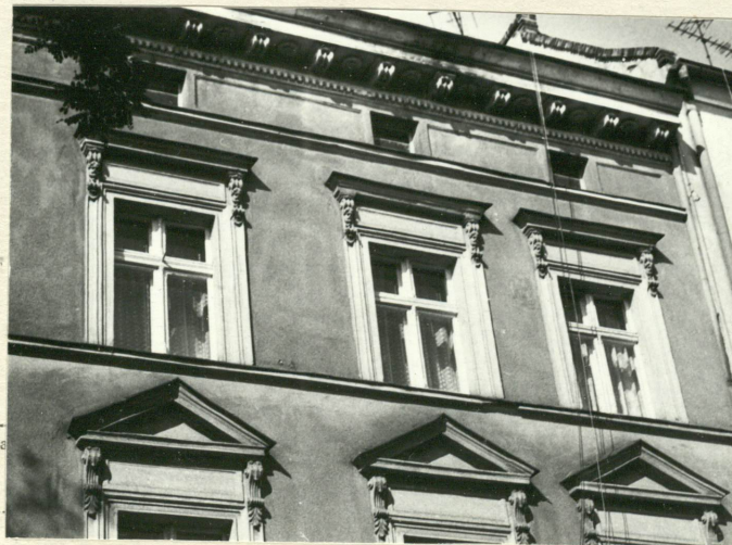
Fasada - fragment zwieńczenia.