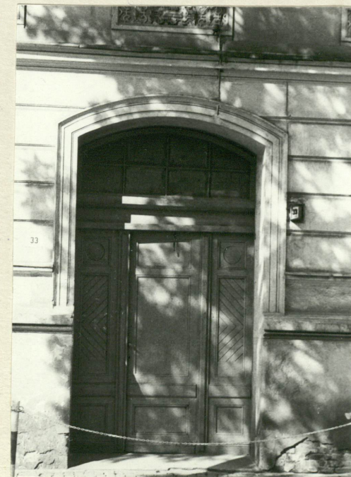
Fasada - brama wejściowa.