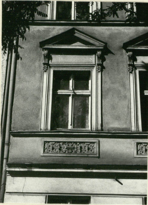
Fasada - okno I piętra.

3. Zawartość wkładki (nazwa obiektu lub materiału uzupełniającego) Fotografie.