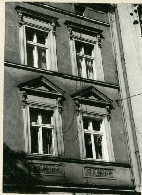
Fasada - część lewa w poziomie I i II piętra.