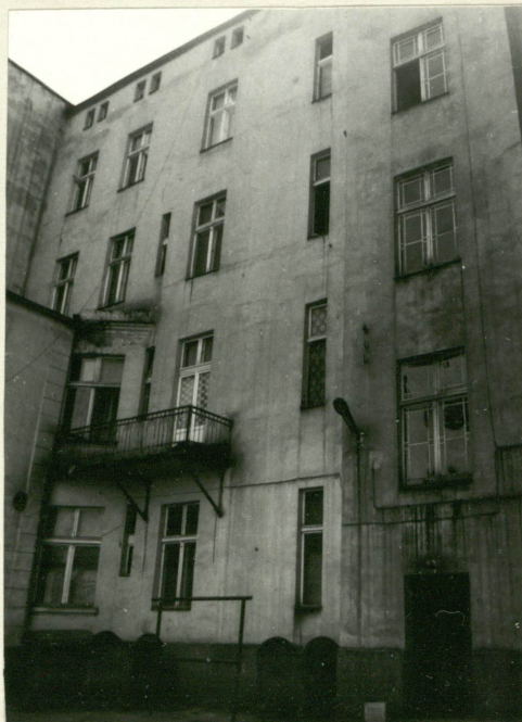
Elewacja tylna /północna/.

Balustrady balkonów III p. wieńczących wykusze posiadają balustrady z boków tralkowe, od przodu płytowe z reliefową dekoracją męskich głów na tle roślinnym. Balkony rozpięte pomiędzy wykuszami posiadają niekonstrukcyjne wsporniki ozdobione wolutami i liśćmi akantu. Elewacja tylna otynkowana gładko, bez ozdób, niesymetryczna sześćoosiowa z ryzalitem klatki schodowej. W I p. pojedynczy płytowy balkon z prostą ażurową dekoracją balustradą ze stalowych prętów, podparty stalowymi wspornikami. Elewacje obu oficyn otynkowane gładko, jedynymi ozdobami są na elewacji oficyny dwukondygnacyjnej poziome płytkie boniowania w tynku, w poziomie przyziemia i dwa pionowe pasy boniowania z boków.