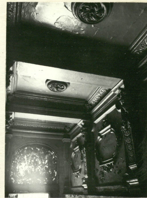
Wnętrze sieni wejściowej - dekoracje stropu i ścian.