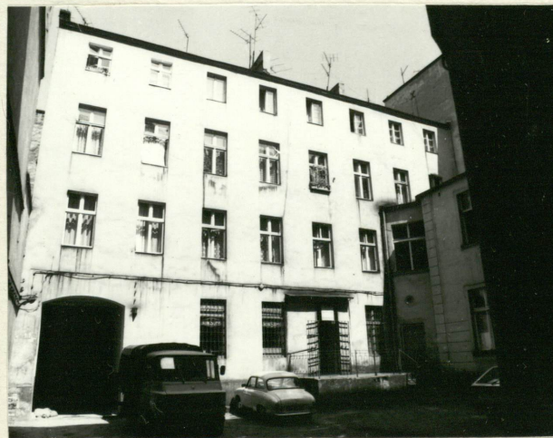
Czterokondygnacyjna oficyna przylegająca do oficyny dwukondygnacyjnej - widok elewacji południowej.