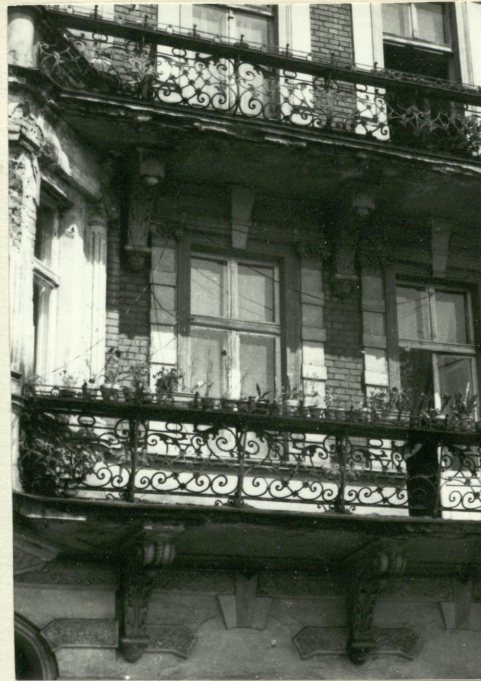
Fasada - balkony I i II piętra.