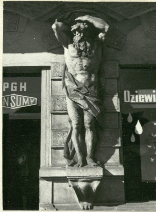
Fasada - atlant dźwigający wykusz lewej strony.