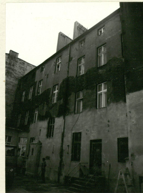
Czterokondygnacyjna oficyna - widok elewacji północnej /tylnej/.