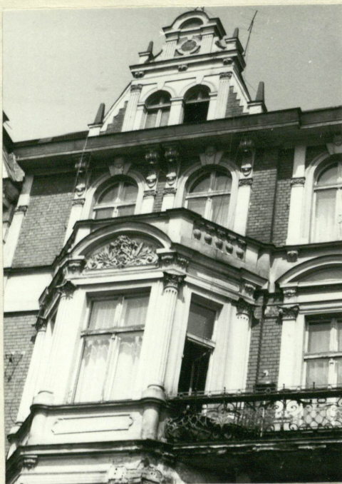
Fasada - fragment zwieńczenia z prawej strony.