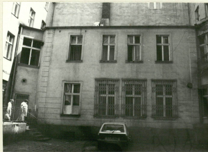
Dwukondygnacyjna oficyna przylegająca do budynku frontowego. Widok od strony zachodniej.