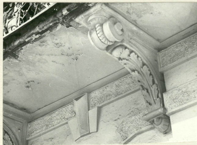
Wsporniki balkonu I piętra. Widoczne uszkodzenia płyty balkonowej.

Instalacje: elektryczna, gazowa, wodociągowa i kanalizacyjna. Ogrzewanie wewnątrz piecami. Piony sanitariatów w mieszkaniach.