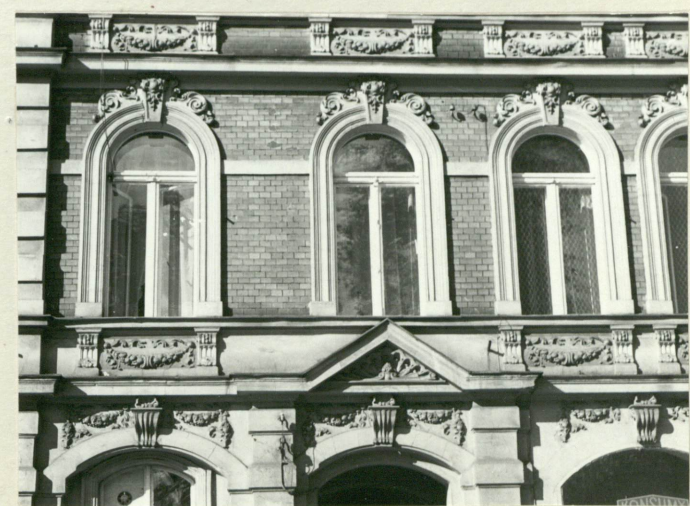
14. Elewacja południowa - okna I p. i zwieńczenia okien parteru oraz wejścia do sieni.