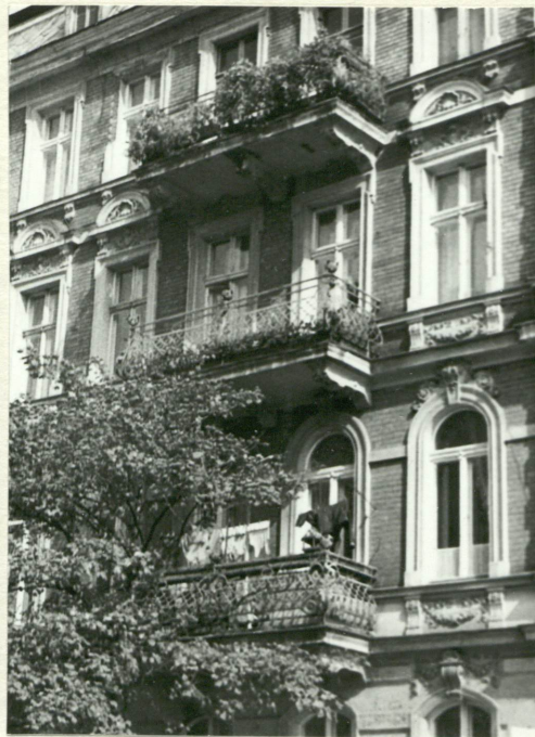
9. Elewacja zachodnia - część środkowa.