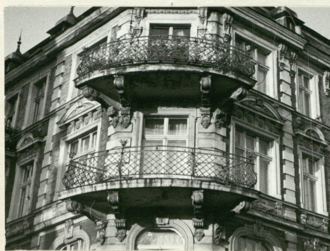
13. Narożnik południowo-zachodni - część środkowa.