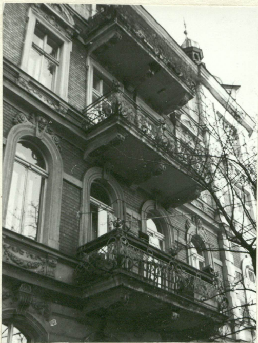
8. Elewacja zachodnia - balkony I, II i III p.