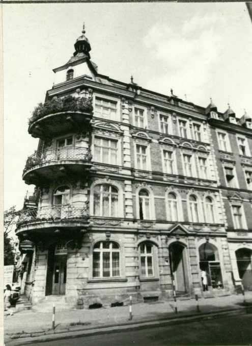
5. Elewacja południowa.