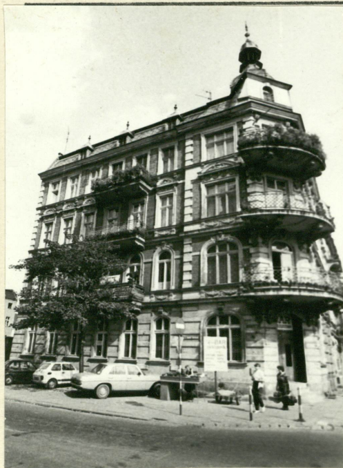
4. Elewacja zachodnia.

3. Zawartość wkładki (nazwa obiektu lub materiału uzupełniającego) Tekst, fotografie.