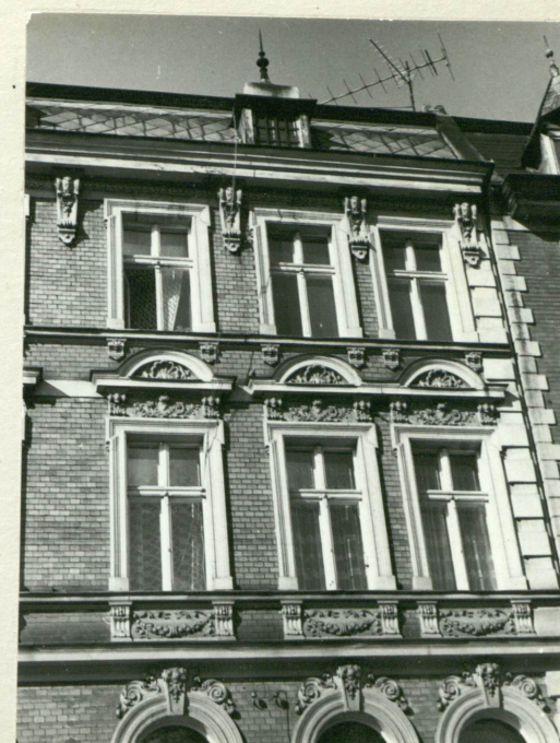
11. Elewacja południowa - fragment w zwieńczeniu.