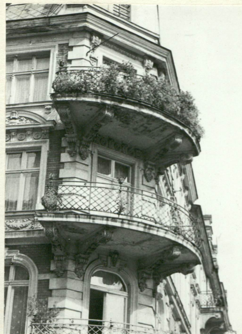
10. Narożnik południowo-zachodni: balkony II i III p.