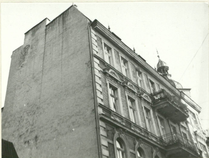
12. Skrzydło zachodnia - widok na część górną od NW.