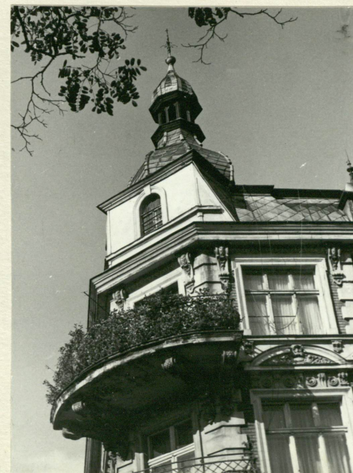
7. Fragment elewacji południowej w zwieńczeniu od strony zachodniej.