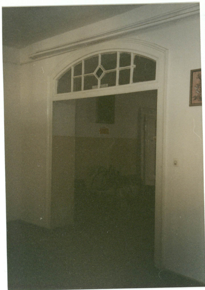
4. Drzwi z nadświetłem na piętrze, neg. 700/758/3