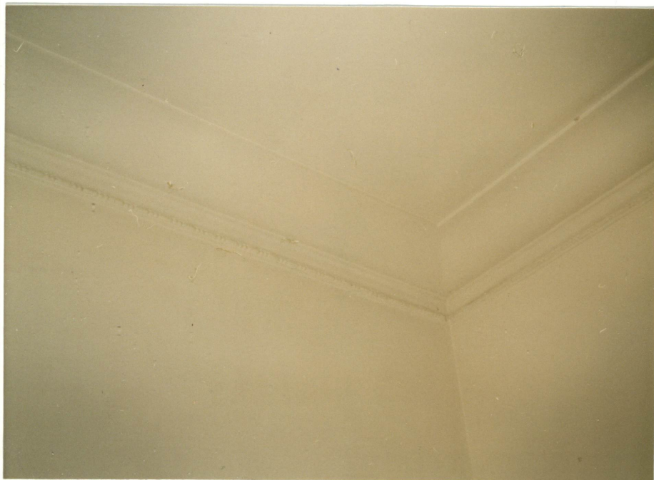
1. Sztukateria sufitu jednego z pokoi parteru, neg. 700/757/5