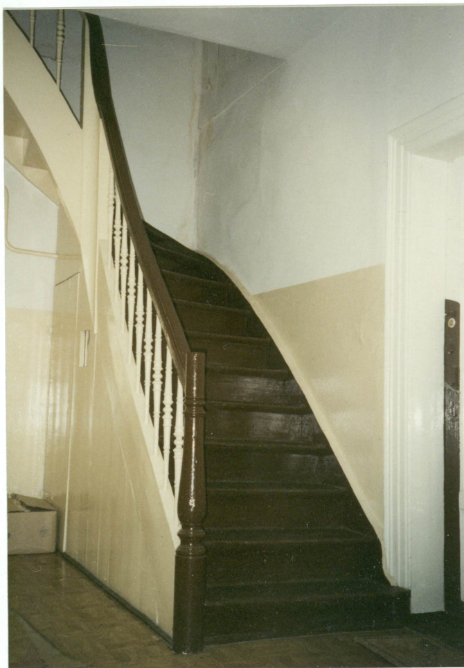
5. Schody na strych, neg. 700/758/2