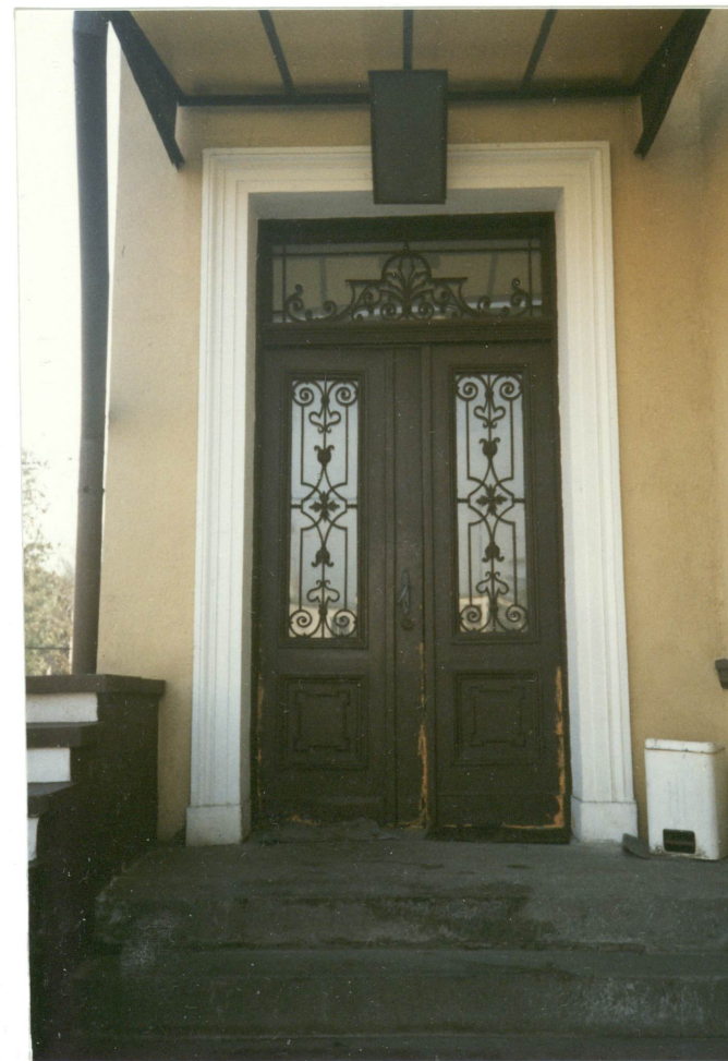
6. Drzwi wejściowe do budynku, neg. 700/723/3