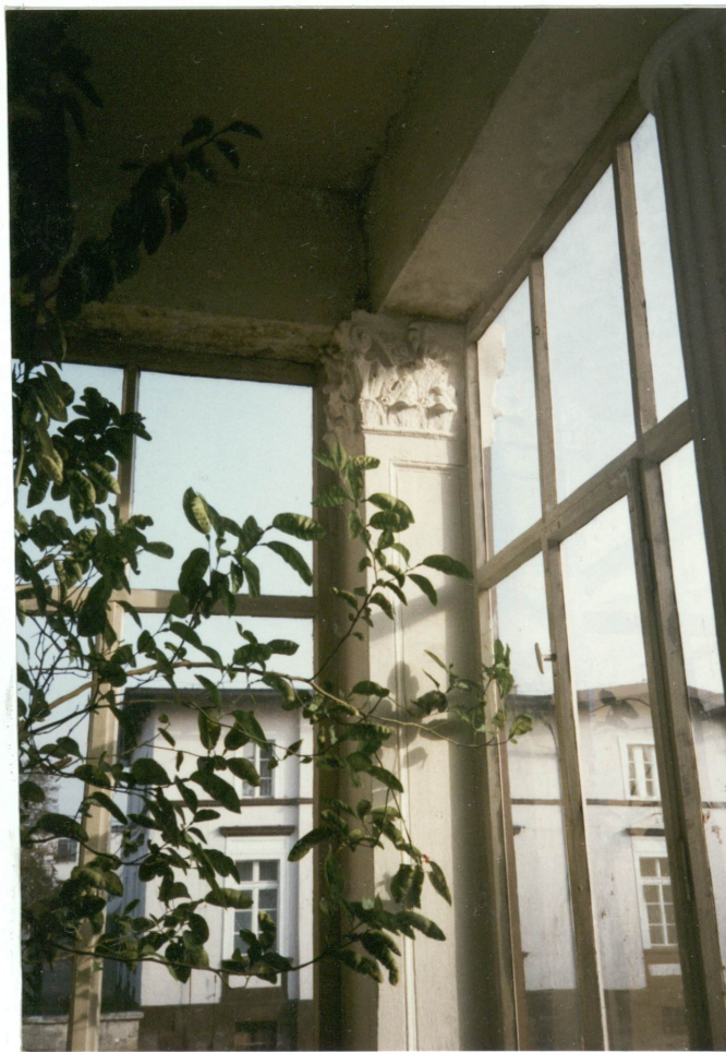
5. Głowica kolumny werandy, neg. 700/723/1