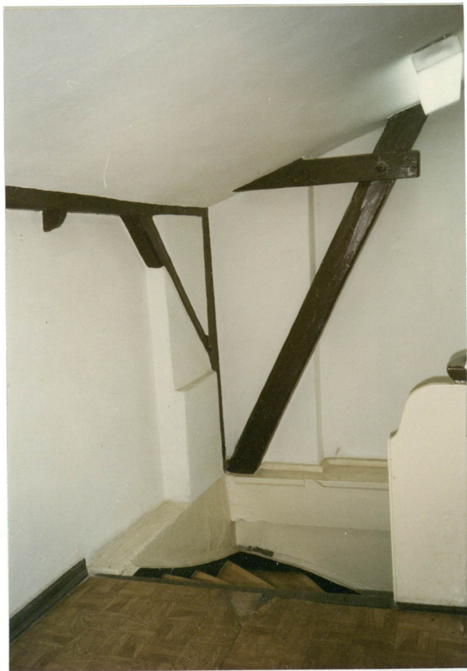
4. Fragment klatki schodowej, neg. 700/758/4