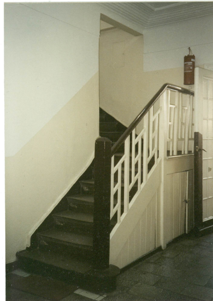
6. Schody na piętro, neg. 700/758/1