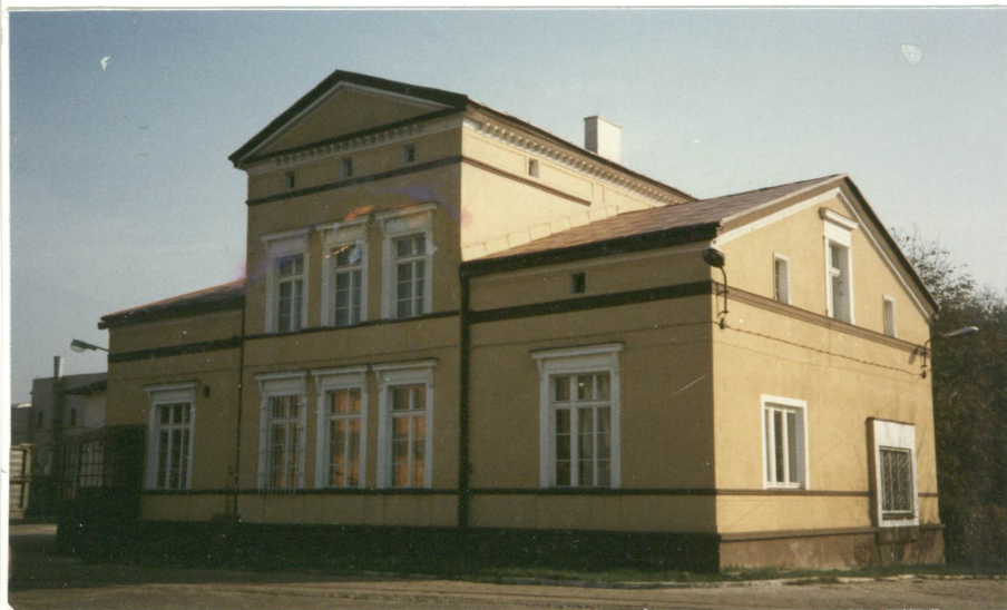
1. Widok ogólny willi od zach., neg. 700/724/1

Dokumentacja fotograficzna i rysunkowa: rzut parteru