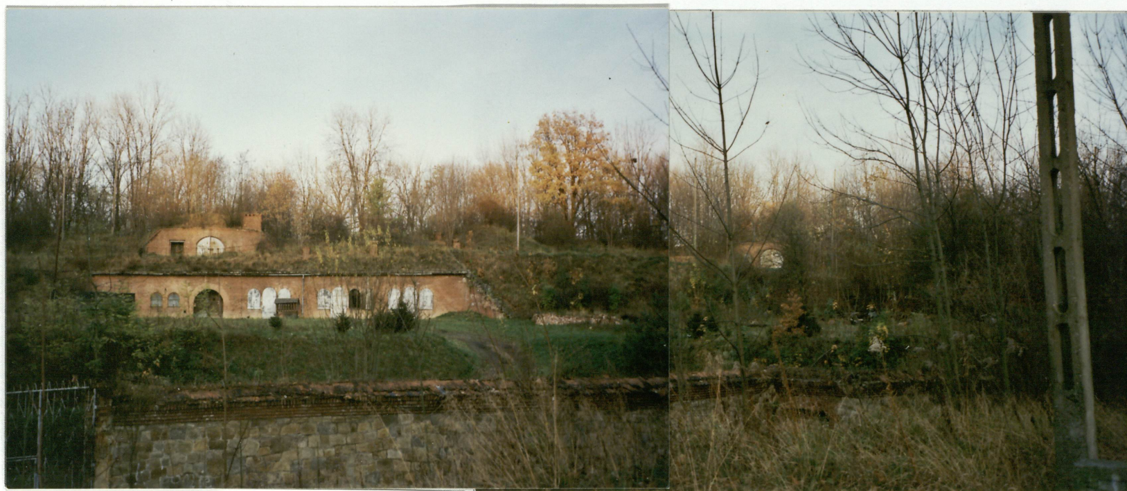
fot 2. Fort I – widok ogólny od południowego zachodu