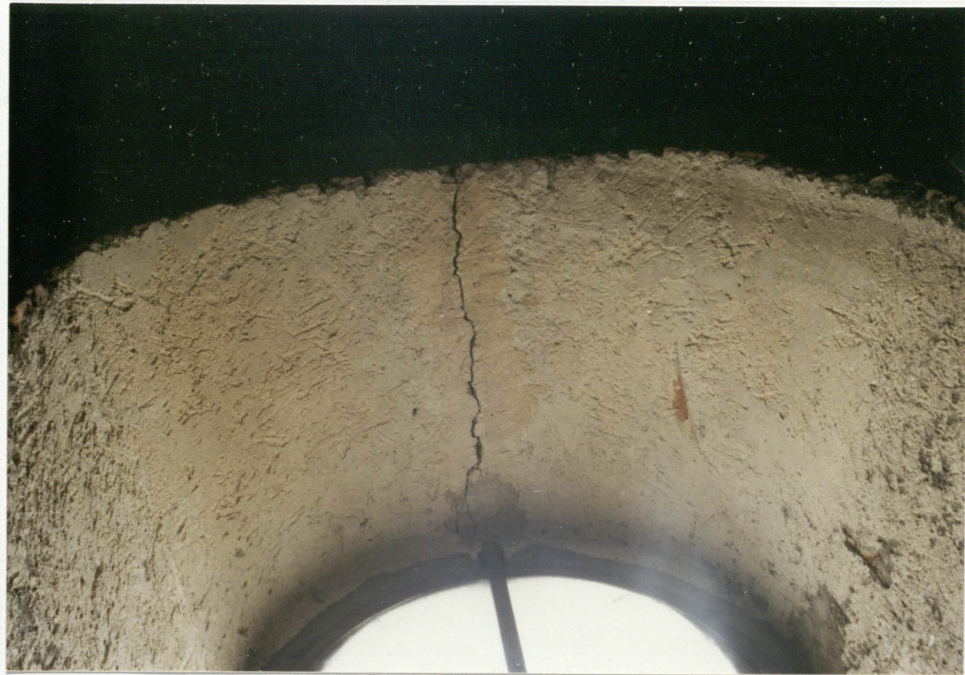
29. Pęknięcie murów wieży. 30. Pęknięcie murów wieży