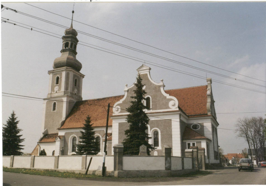
2. Widok kościoła od pd.