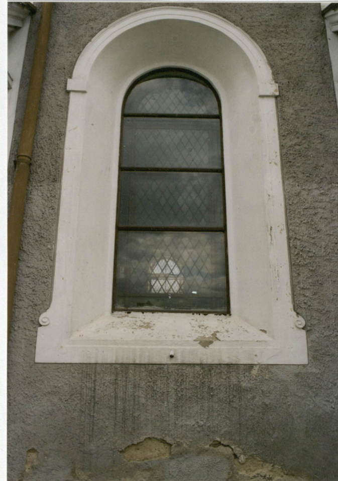
15. Okna aneksu prezbiterialnego. 16. Jedno z okien nawy.