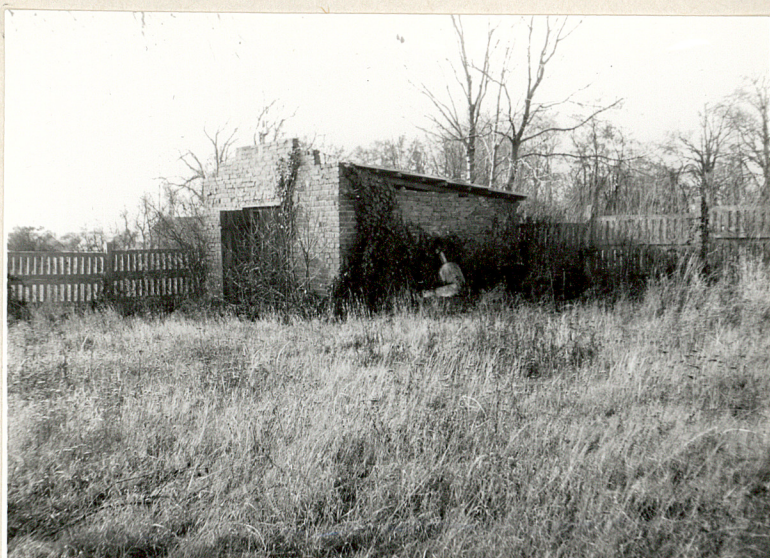
4. Budynek gospodarczy