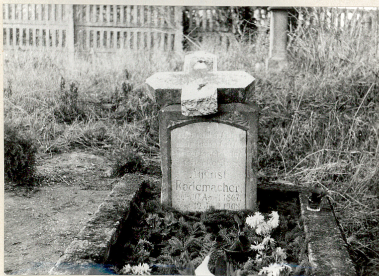
6. Najstarszy zachowany nagrobek z 1908 r.