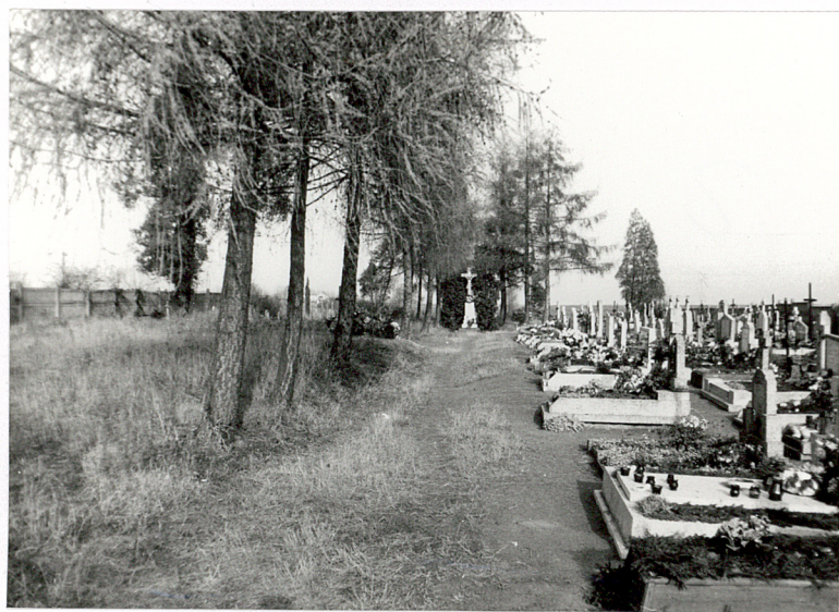
2. Obsadzona modrzewiami alejka główna.