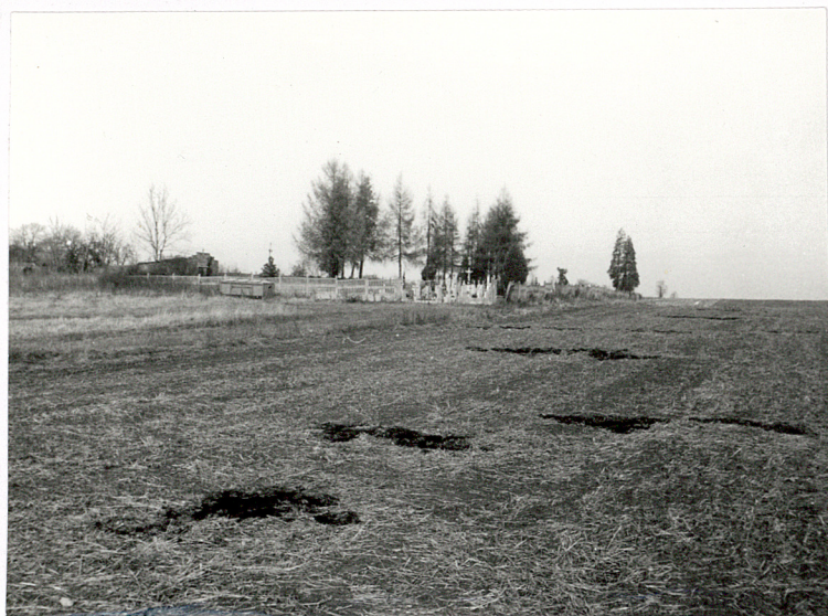
1. Widok cmentarza od strony połud.- wschodniej.