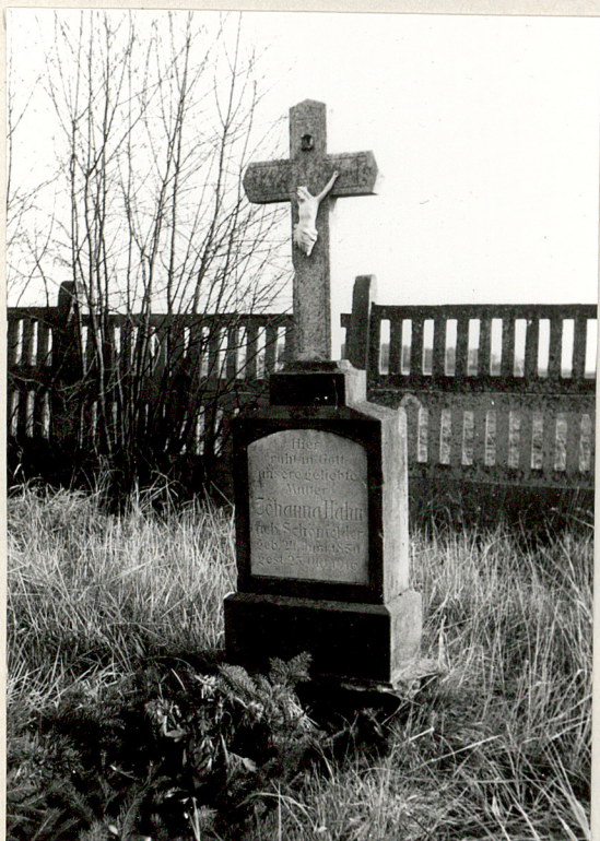
5. Jeden z najstarszych zachowanych nagrobków / z 1916r/