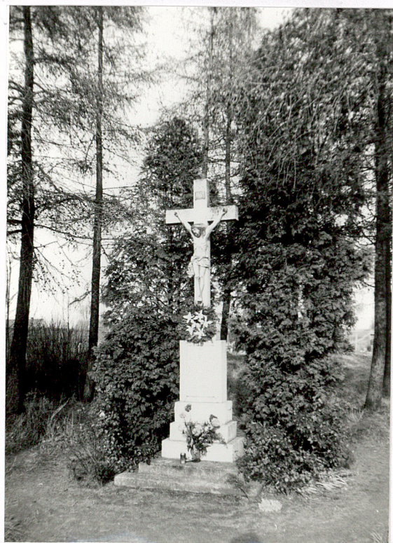
3. Krzyż cmantarny