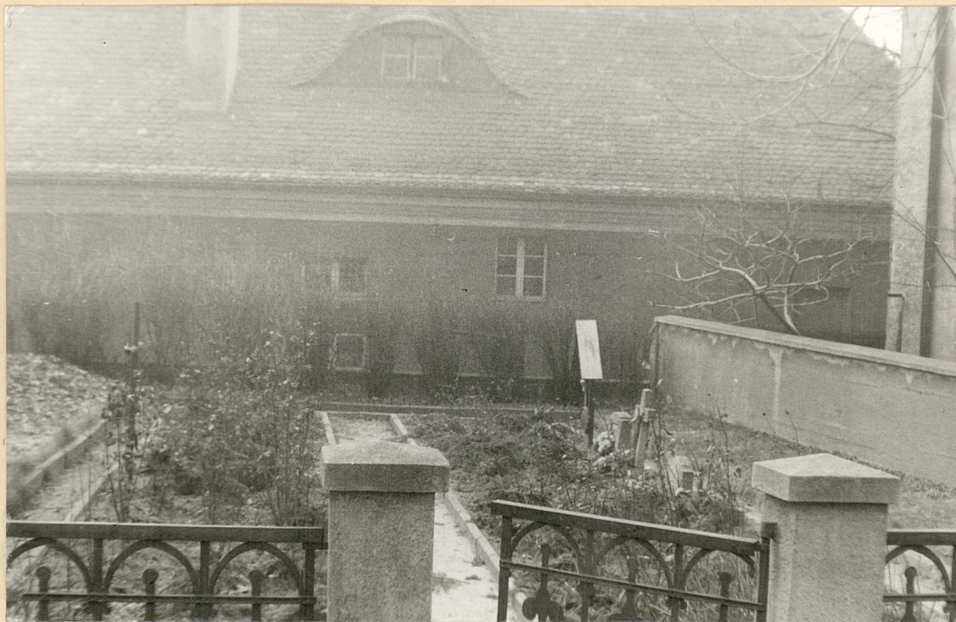
Fot.nr 1 widok cmentarza na tle budynku muzeum.