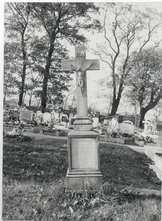
7. Najstarszy zachowany in situ nagrobek z 1900 r.