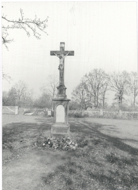
6. Krzyż cmentarny