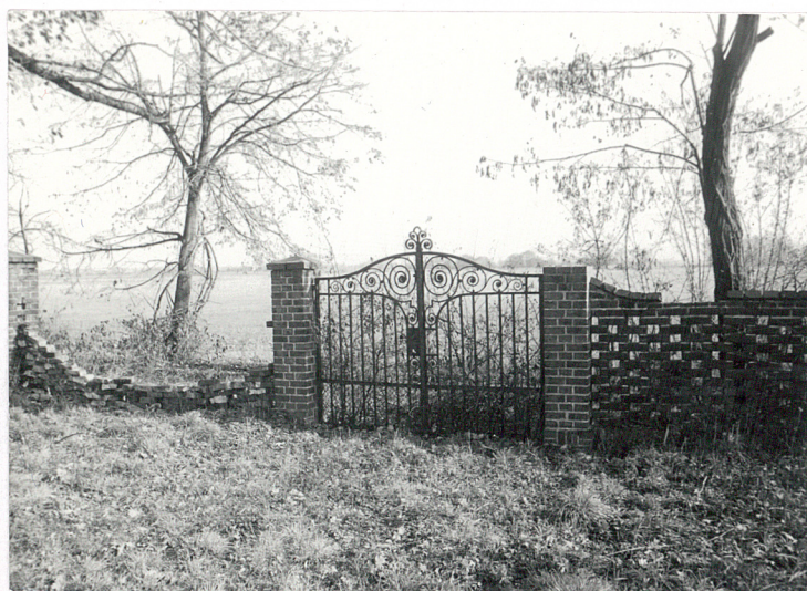
3. Brama w ogrodzeniu pola grobowego rodziny Wiehalhaus