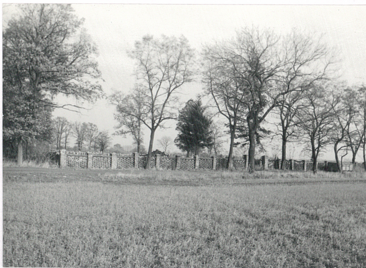
1. Widok cmentarza od strony południowej