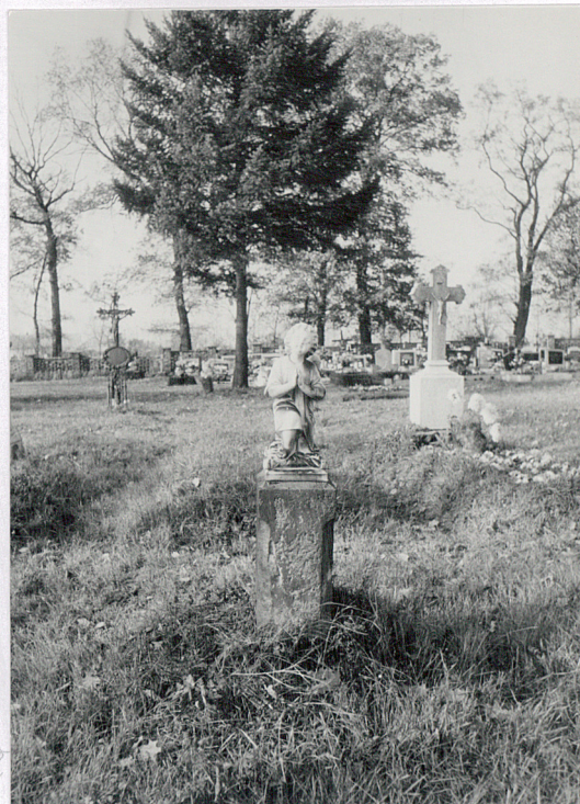
5. Nagrobek, rzeźba na cokole w połud. części cmentarza.