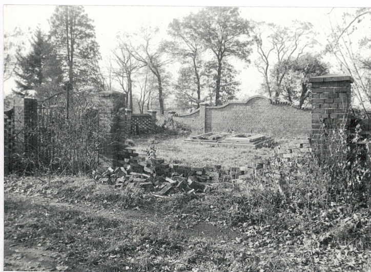
2. Pole grobowe rodziny Wiehelhaus ostatnich właścicieli majątku w Niewodnikach