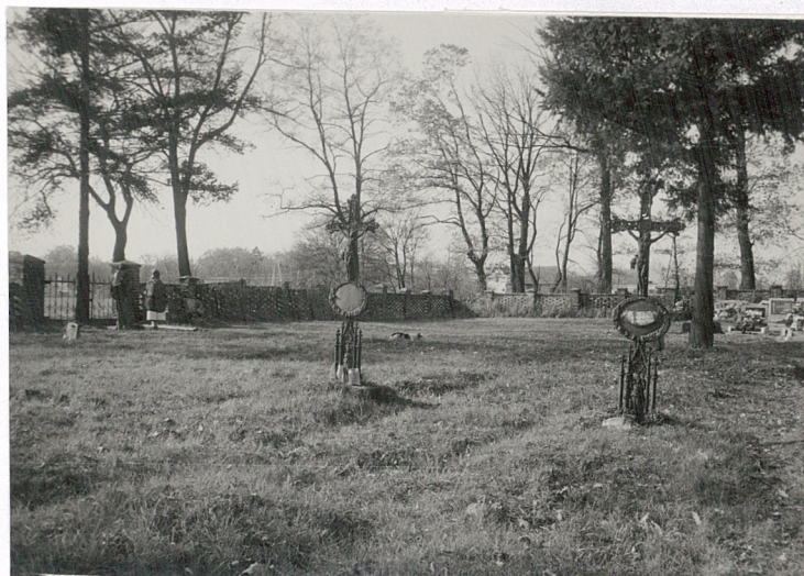
4. Nagrobki w formie żeliwnych krzyży w połud. części cmentarza