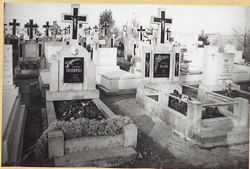
WIDOK NAGROBKÓW CMENTARZA