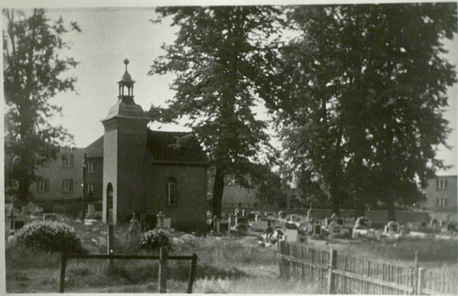
Ogólny widok cmentarza