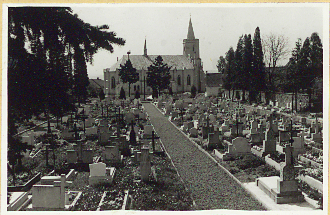
Widok of strong pol H kierunek Koscioła (czas południowy)