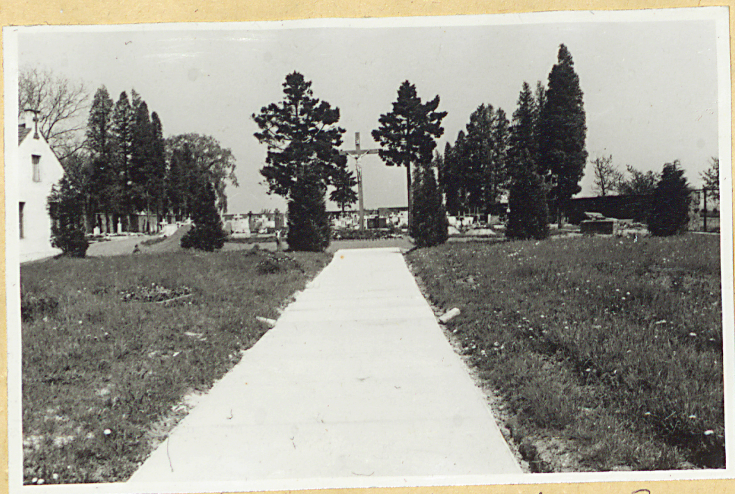
Widok z. of strong Koscioła (czas południowy)