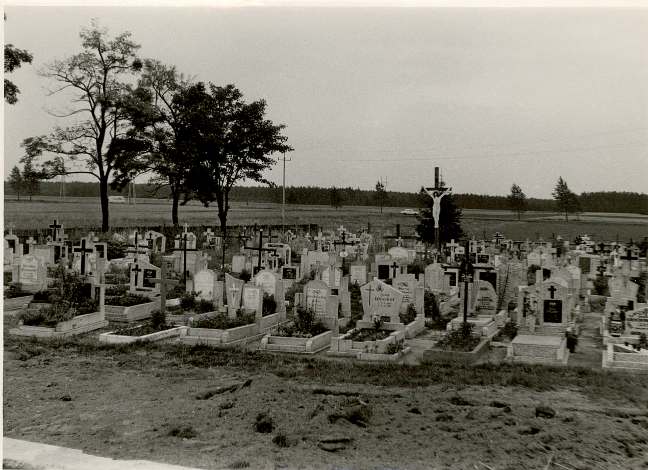
Zdjęcie wykonane od strony północnej i obejmuje widok ogólny cmentarza z bramy wjazdowej.