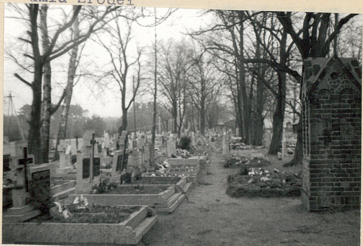
3. Zachodnia część cmentarza-po powiększeniu /widoczny pozostawiony filar ogrodzenia/