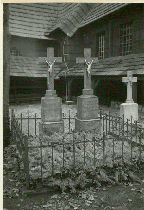
11.Nagrobki przy kościele