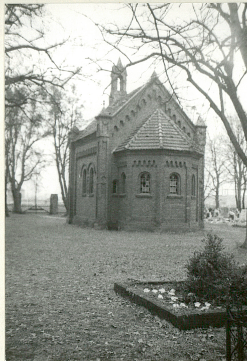
15. Kaplica w pld. części cmentarza- widok od północy