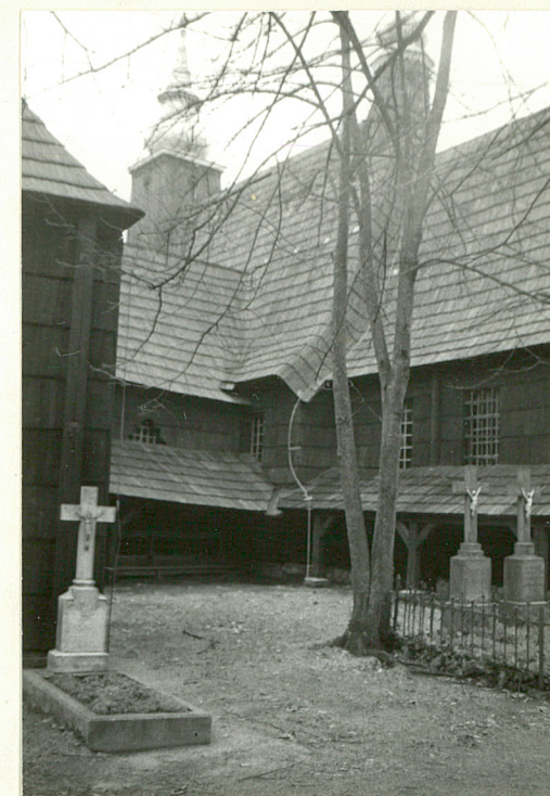
10.Fragment pierwotnej części kościoła p.w. św. Anny