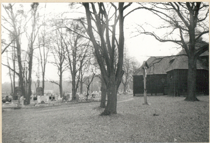
7. Południowo-zachodnia część cmentarza