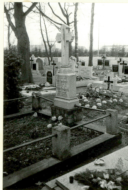
22. Nagrobek małżeństwa Pawełczyków, ok. 1930