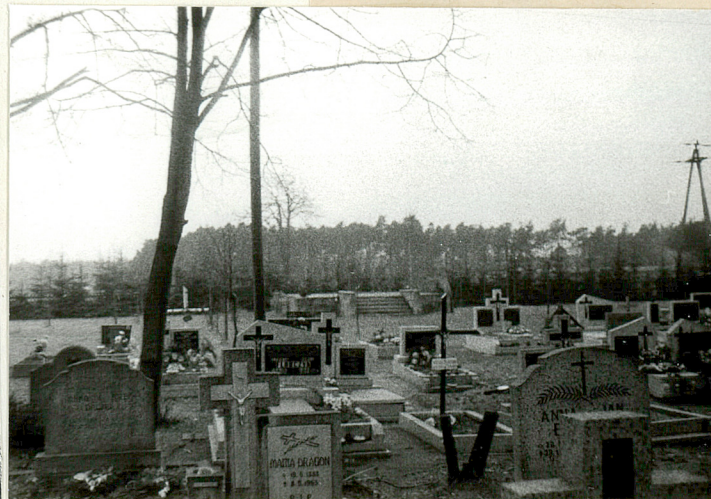
17. Zachodnia część cmentarza