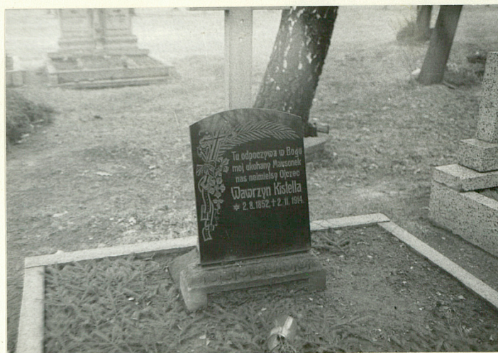
9.Nagrobek we wsch.części cment.