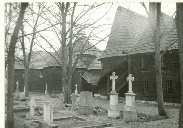
13.Widok kościoła od str.wschodniej