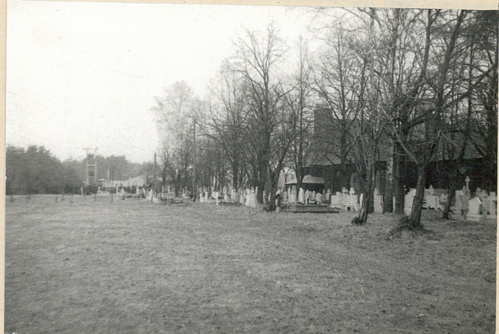
5. Powierzchnia wolna-zachodnia część cmentarza