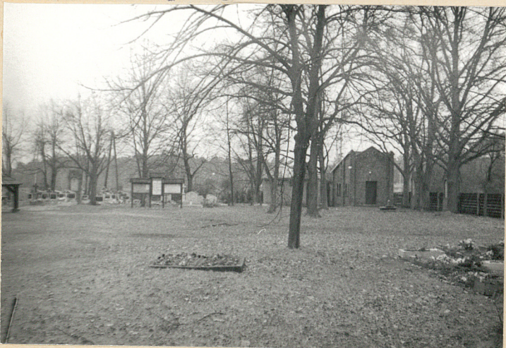
6. Północna część cmentarza