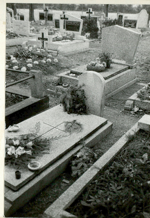
19. Nowa część cmentarza- układ grobów