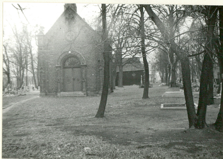
14. Kaplica w pld. części cmentarza- widok od południa