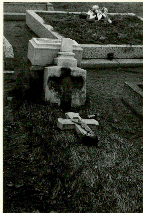
26. Uszkodzony nagrobek Józefy Słobosz, zm. 1909