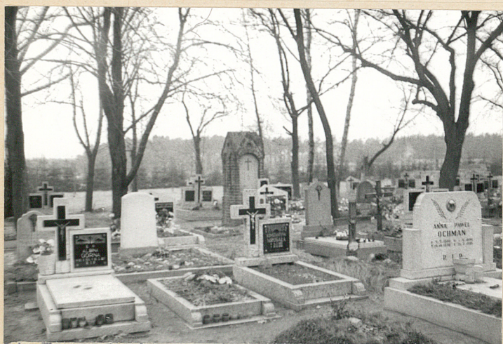
4. Zachodnia część cmentarza-widok od wschodu /widoczny pozostawiony filar dawnego ogrodzenia/