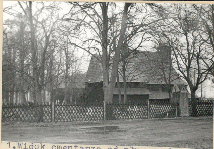
1. Widok cmentarza od pñ.-wsch. /ze skrzyżowania ul. Gorzowskiej i Siemiu Zródeł