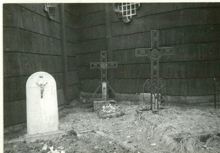
12.Nagrobki przy XVII wiecznej części kościoła