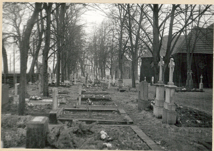
2. Wschodnia część cmentarza