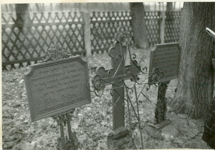
8.Mogiły z żeliwnymi tablicami-tablica z lewej-najstarszy grób Feliksa Osfiry +1847/wsch.cz.śc cment./