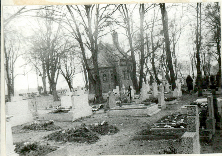
16. Południowa część cmentarza