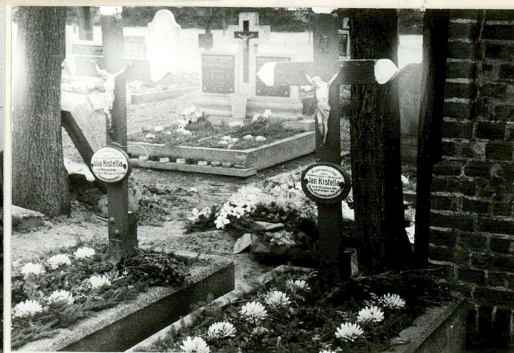
18. Mogiły z drewnianymi krzyżami