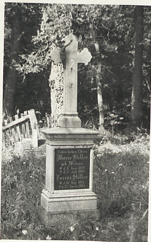
Meden 2 najstarszych opobowców