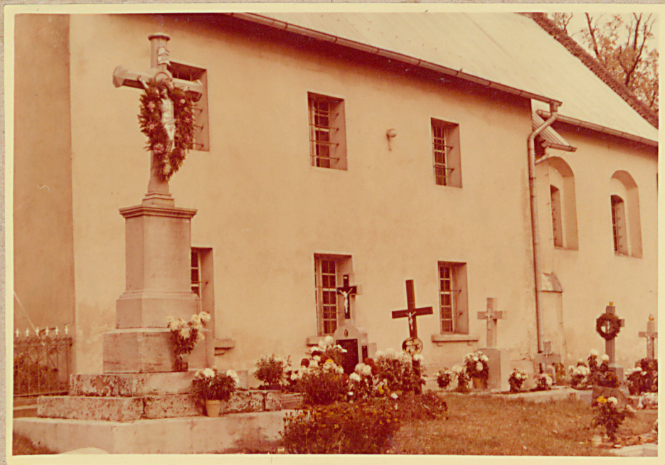
KOŚCIÓŁ WIDOK OD STRONY POŁUD. - WSCH.