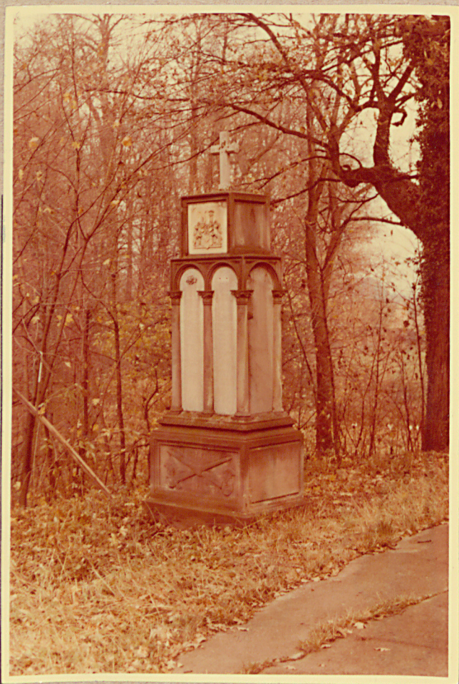
POMNIK POŁNOĆNA CZĘŚĆ CMENTARZA