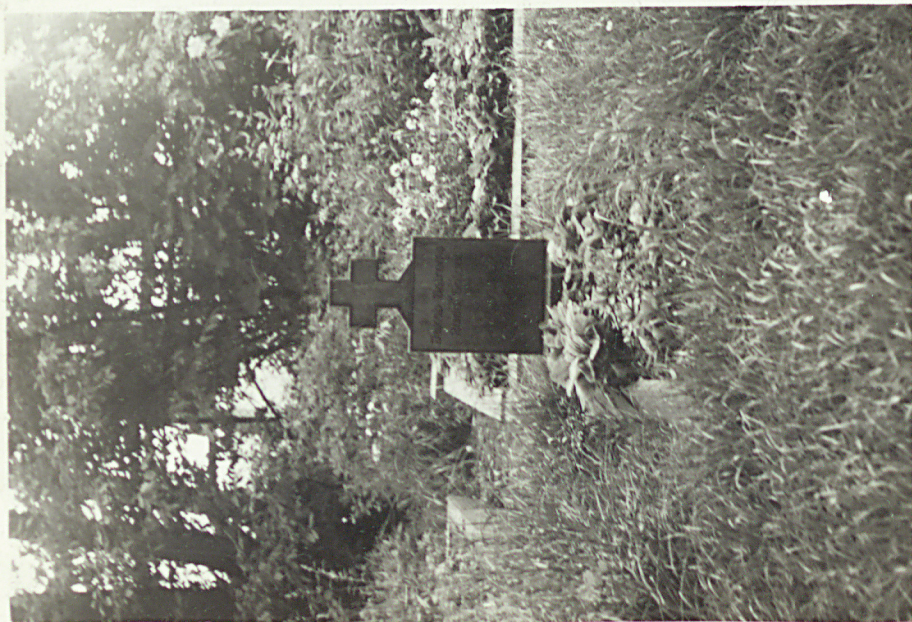
NAGROBEK : KOBIECY (?) ZADLECKIEGO ŻOŁNIERZA ZIOŁEŁEGO W I WOJNIE ŚWIATOWEJ