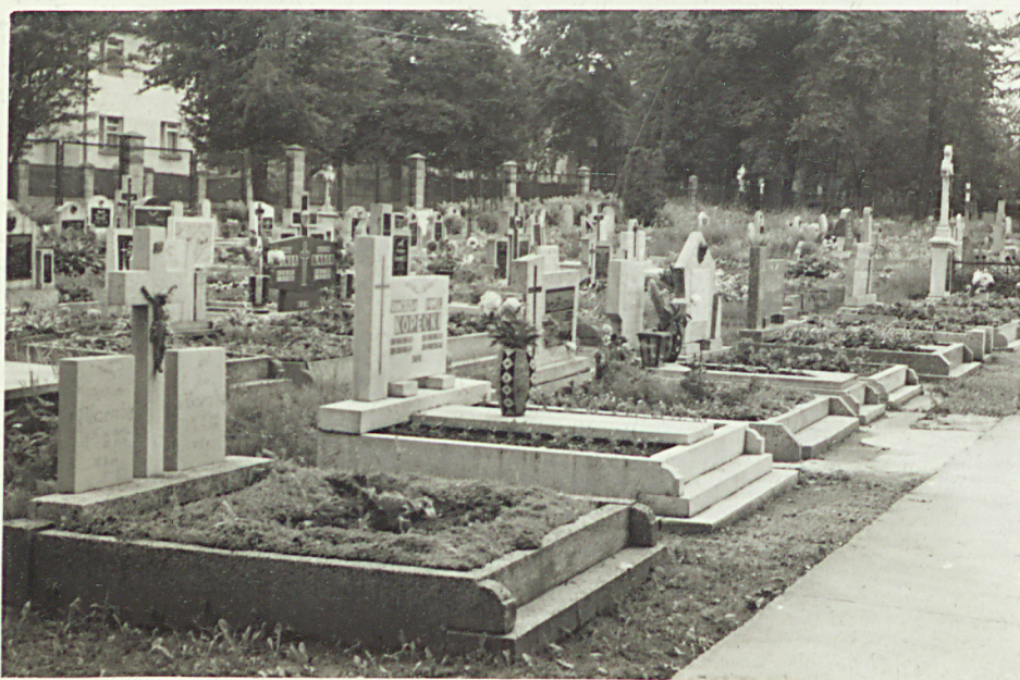
OGÓLNY WIDOK CMENTARZA