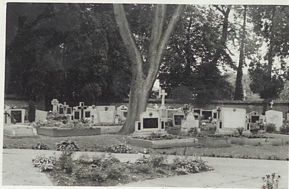
Widok ogólny cmentarza.