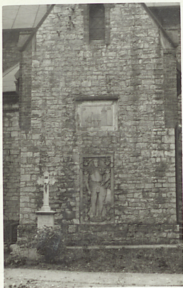
ŻYTA NAGROBNA KASPA ROMANOWICZEGO JÓZEFOWICZOWICZA DOBREJ (zm. 1611)