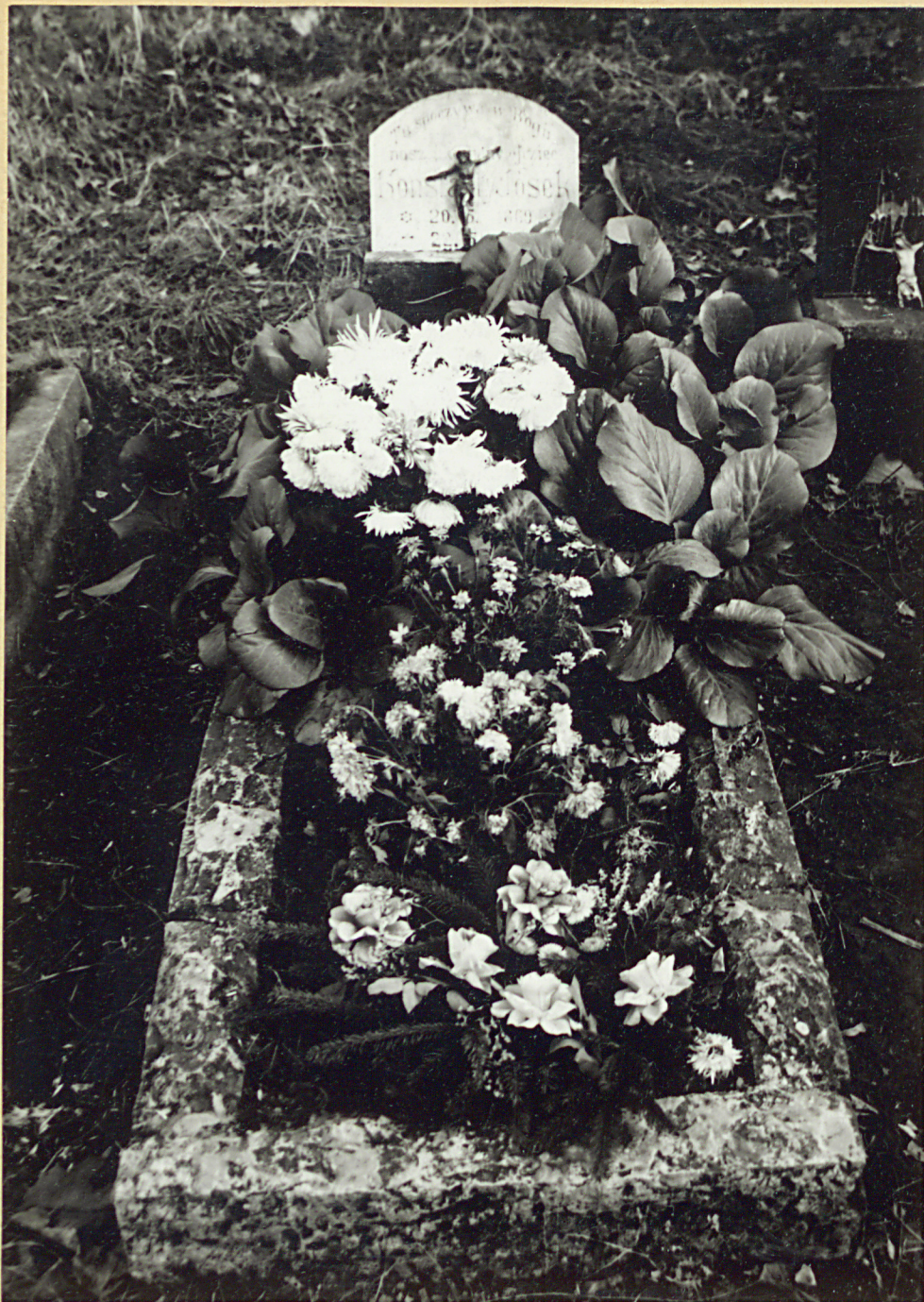
1. Grób Konstantego Goska - powstańca śląskiego