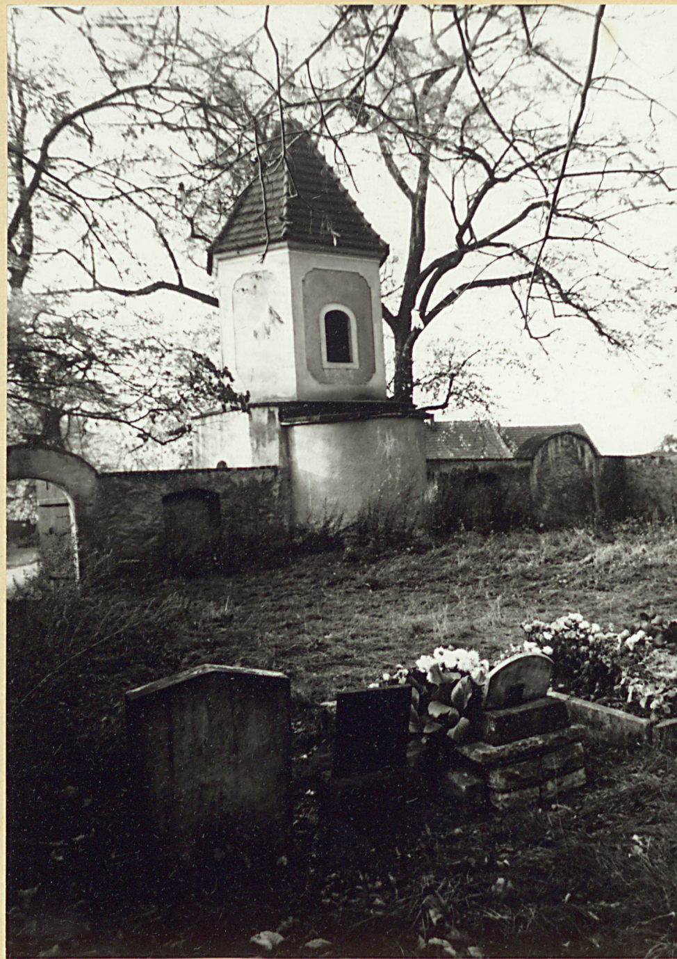
2. Fragment grobów oraz kaplicy z dzwonnica.