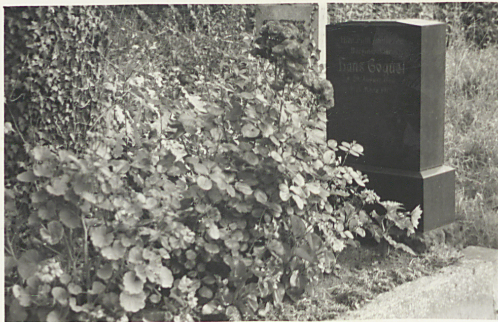
Widok z najstarszych grobowców