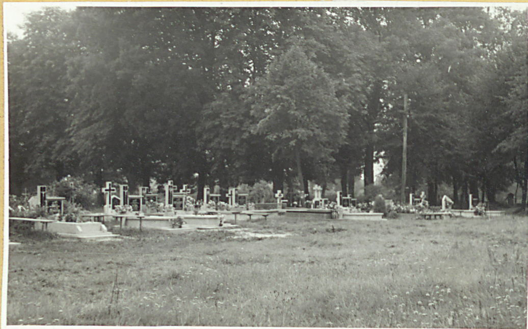
Widok na połudn.-wschod. stronę cmentarza