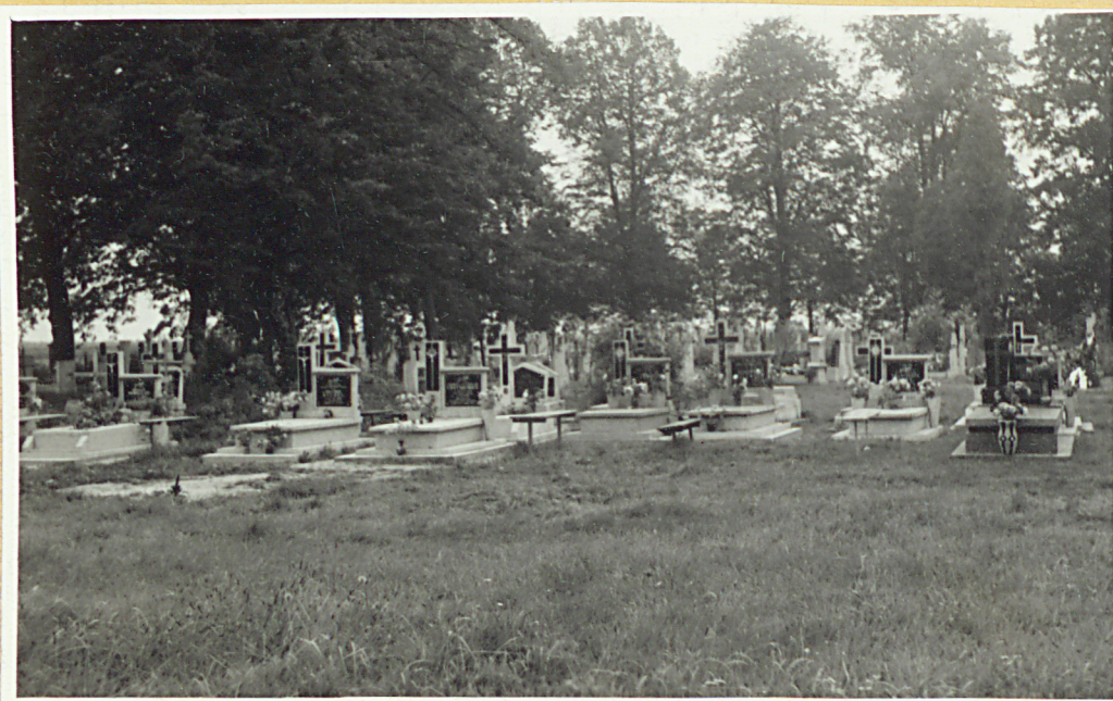
Widok na południowo-wschodn. stronę cmentarza