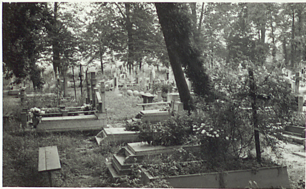
Widok na połudn. stronę cmentarza