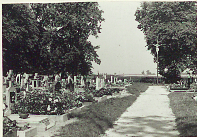
Widok ogólny z aleji głównej, strona lewa