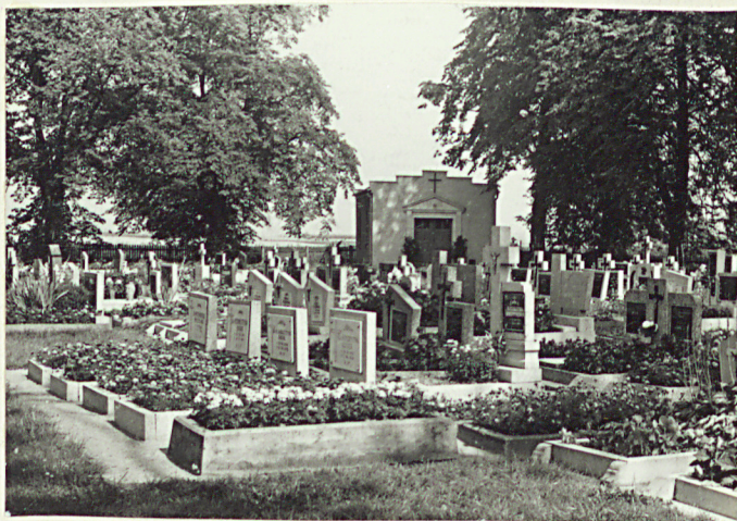
Widok ogólny cmentarza z aleji głównej, strona lewa. w głębi dom przed pogrzebowy